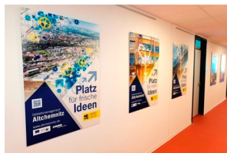
Plakataktion im Technischen Rathaus