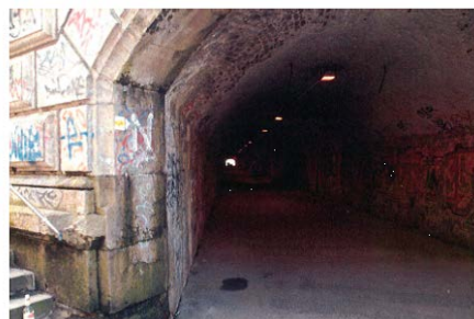
Angstraum Tunnelröhre vorher