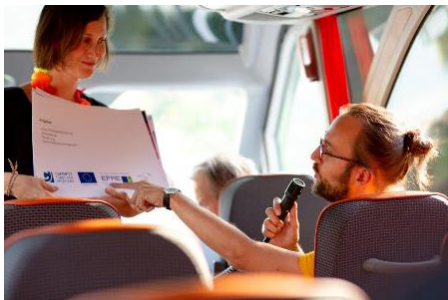
Stadtteilmanager Wirtschaft Herr Verch