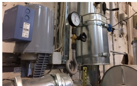
nachgerüstete Heizanlage mit Fernwärme