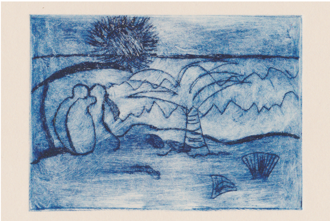
Beispiele der Ausstellung