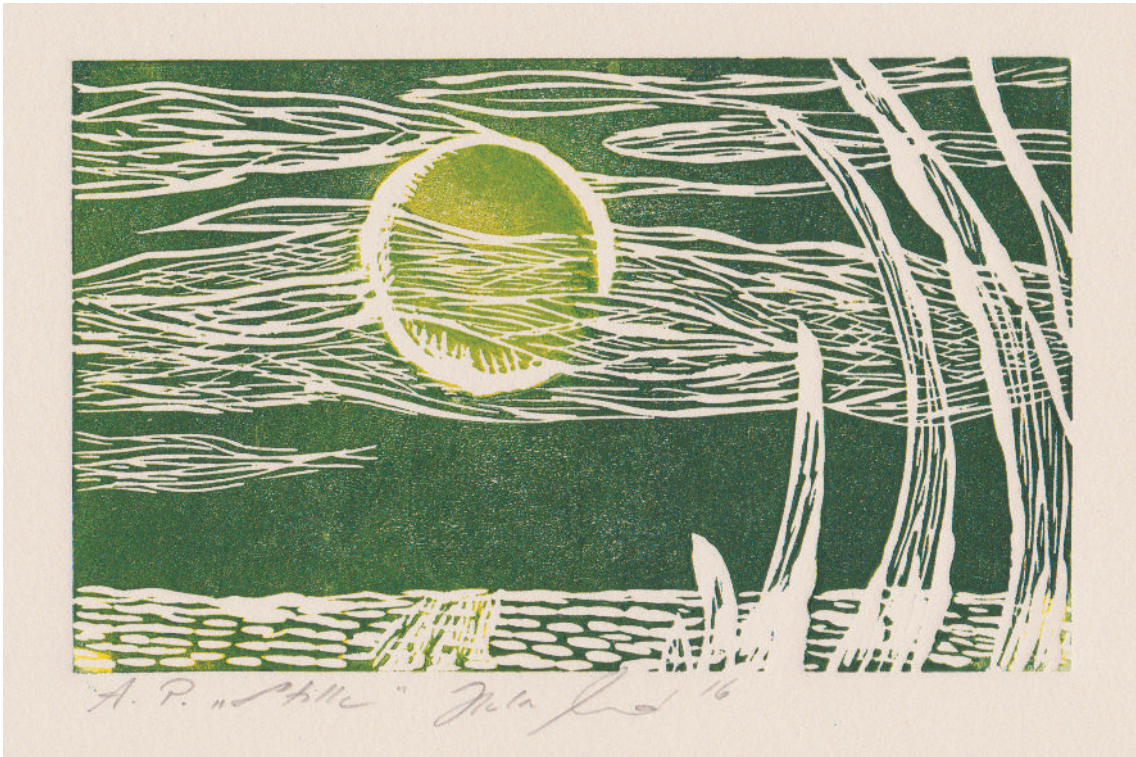
Beispiele der Ausstellung