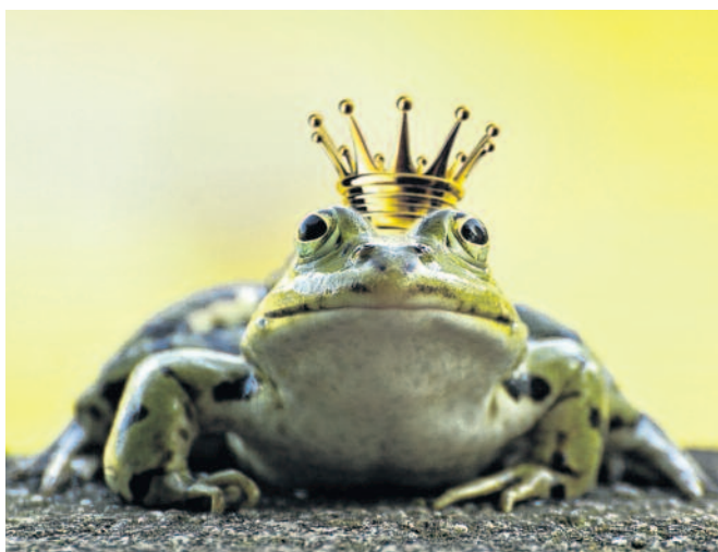
Dem Wappentier des Chemnitzer Tierparks kommt beim Jubiläumsfest besondere Bedeutung bei.

Die Aktivitäten zum Tierparkgeburtstag sollen sich nicht nur auf das eigentliche Jubiläum, sondern auf das ganze