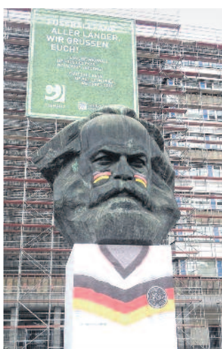
Zur Fußball-WM sollte das Karl-Marx-Monument das deutsche Nationaltrikot tragen. Die Werbeagentur Zebra entrollte vor dem zum Denkmal gehörenden Ausspruch des Philosophen »Proletarier aller Länder vereinigt Euch« ein Plakat mit der Aufschrift: »Fußballfans aller Länder, wir grüßen Euch«.

Die Fußball-WM als eines der größten internationalen Sportereignisse wollte Chemnitz als Chance nutzen, um sich charmant und mit einem Augenzwinkern als weltoffene Stadt zu präsentieren. Das Karl-Marx-Monument zeigte sich im Trikot als größter Fan der