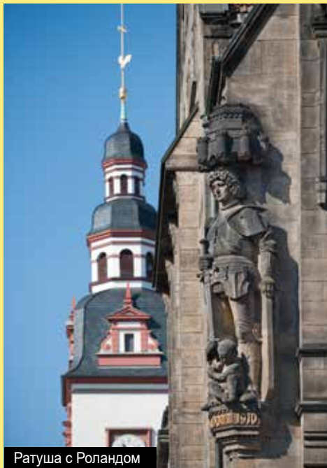
Ратуша с Роландом