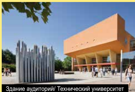
Здание аудиторий/ Технический университет