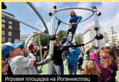
Игровая площадка на Йоганнисплац