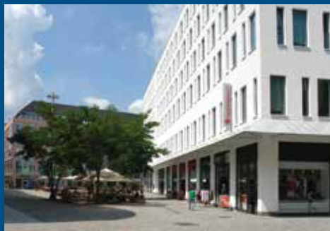
Bürgerhaus am Wall (Городской дом Ам Валь) Düsseldorfer Platz 1, 09111 Chemnitz