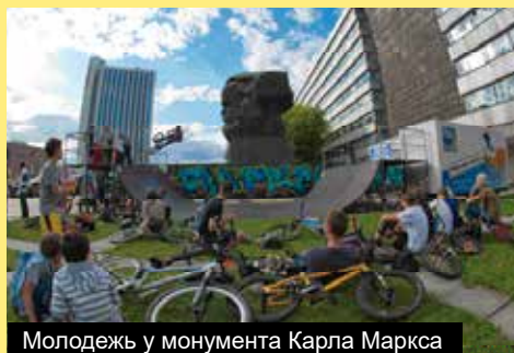
Молодежь у монумента Карла Маркса