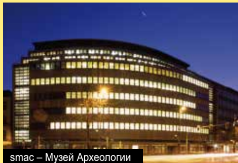
смас – Музей Археологии