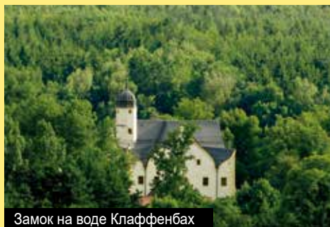
Замок на воде Клаффенбах