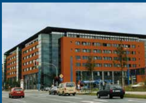
Moritzhof Bahnhofstraße 53, 09111 Chemnitz