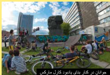
جوانان در کنار بنای یادبود کارل مارکس