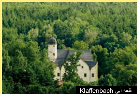
قلعه آبی Klaffenbach