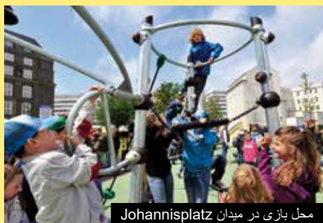
محل بازی در میدان Johannisplatz