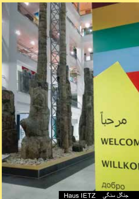
جنگل سنگی Haus IETZ