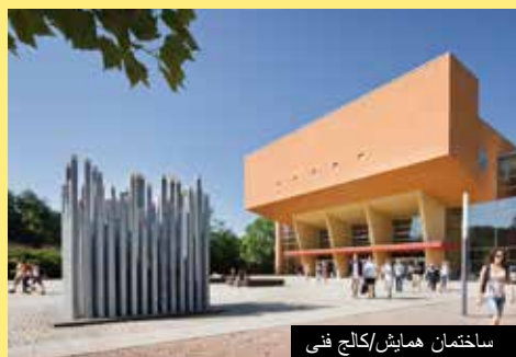
ساختمان همایش/کالج فنی