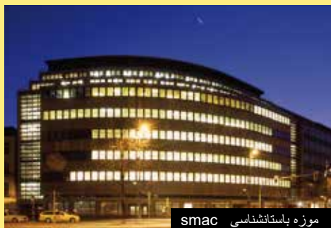
موزه باستانشناسی smac