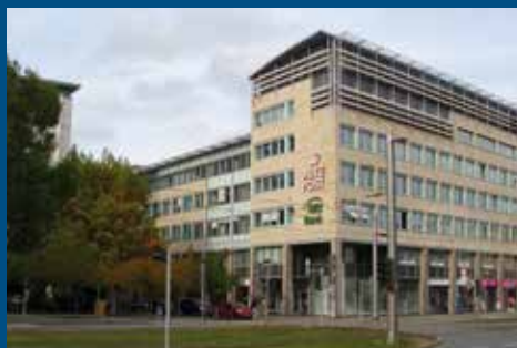
Neubau an der Alten Post Bahnhofstraße 54 a, 09111 Chemnitz

شهر کمیتس - اداره شهروندان، اداره نام نویسی، اداره تابعیت، اداره امور اتباع خارجی