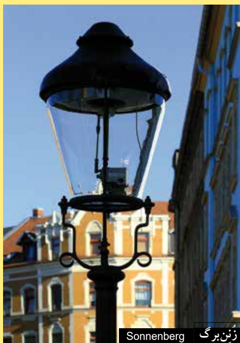
زُنين بَورگ Sonnenberg