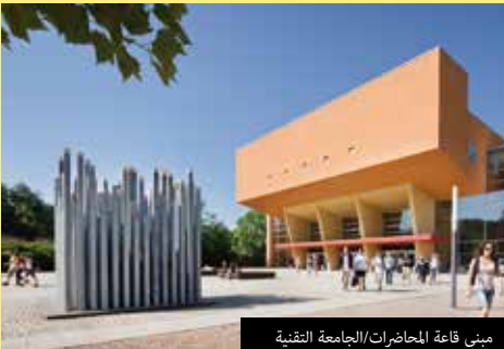
مبنى قاعة المحاضرات/الجامعة التقنية