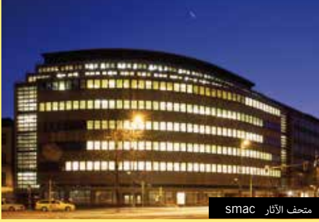
متحف الآثار smac