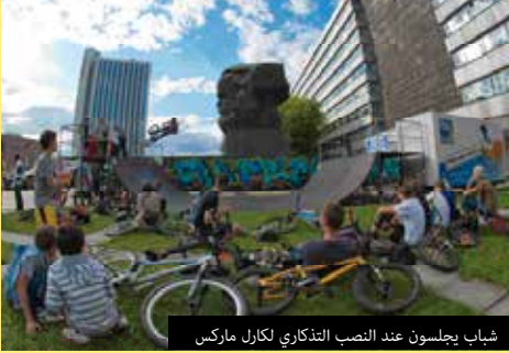
شباب يجلسون عند النصب التذكاري لكارل ماركس