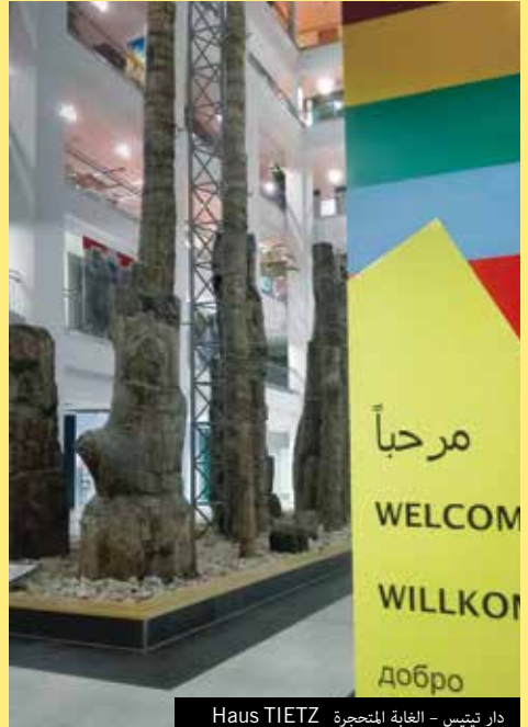
دار تيتس - الغاية المتحجرة