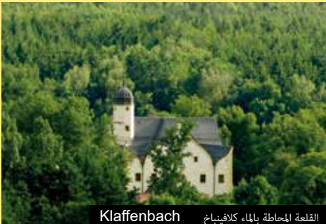
القلعة المحاطة بالماء كلافينباخ