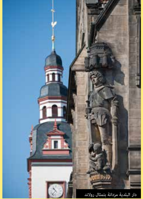
دار البلدية مزدانة بتمثال رولاند