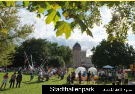
متنزه قاعة المدينة Stadthallenpark