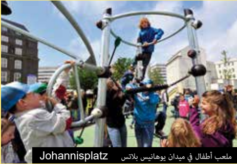
ملعب أطفال في ميدان يوهانيس بلاتس