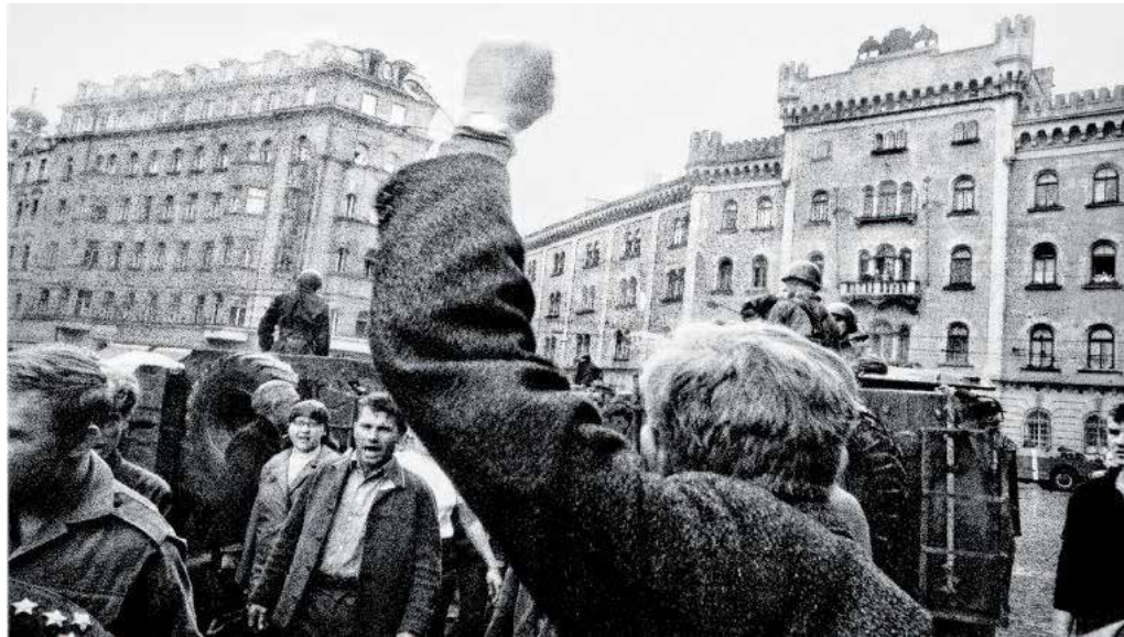
Foto: Josef Koudelka Platz der Republik, Invasion 68 / Náměstí Republiky, Invaze 68, 1968 Inkjet Print, 65,5 x 100 cm Kunstgewerbemuseum Prag / Uměleckoprůmyslové museum v Praze Schenkung der Josef Koudelka Foundation © Josef Koudelka / Josef Koudelka Foundation

Die darauf folgende, vergleichsweise kurze, jedoch international ausstrahlende Phase der Liberalisierung fand mit der Niederschlagung des Prager Frühlings im August 1968 ein jähes Ende. Ungeachtet der tiefgreifenden staatlichen Einflussnahme kam es in