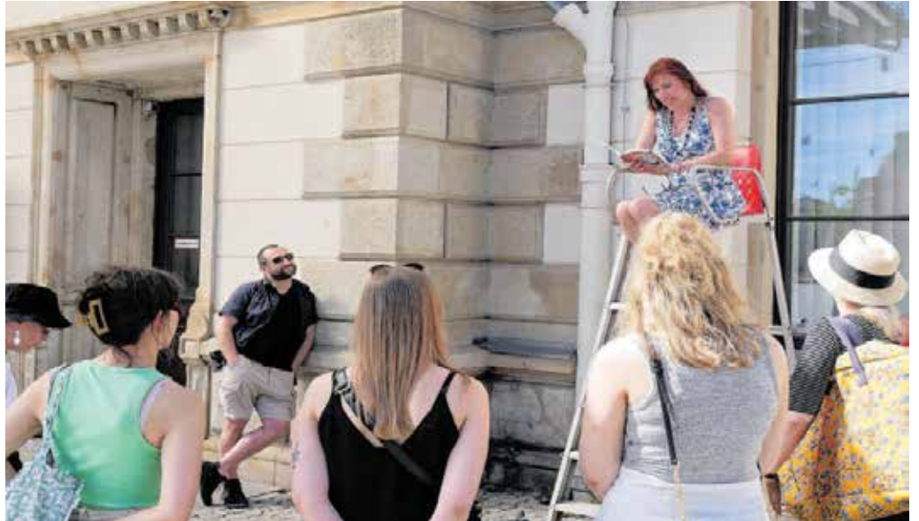
Gut besucht war das Mikroprojekt »Flanierlesen« zum Kosmos Chemnitz 2022.

Vereine, Initiativen und engagierte Einzelpersonen können bis zum 16. Dezember ihre Projektideen für die aktuelle Runde digital über folgende Plattform einreichen: www.chemnitz2025.de/mikroprojekte Mikroprojekte können mit einer Summe von jeweils bis zu 2.500 Euro unterstützt werden. Projekte mit einer gut ersichtlichen europäischen Dimension können bis zu 3.000 Euro erhalten. Ein eigener Beitrag zur Finanzierung wird nicht vorausgesetzt. Die Mikroprojekte müssen – beginnend ab Februar – im ersten Halbjahr 2023 umgesetzt werden. Die Jury tagt Anfang Januar zu den eingereichten Projekten und wird im An-