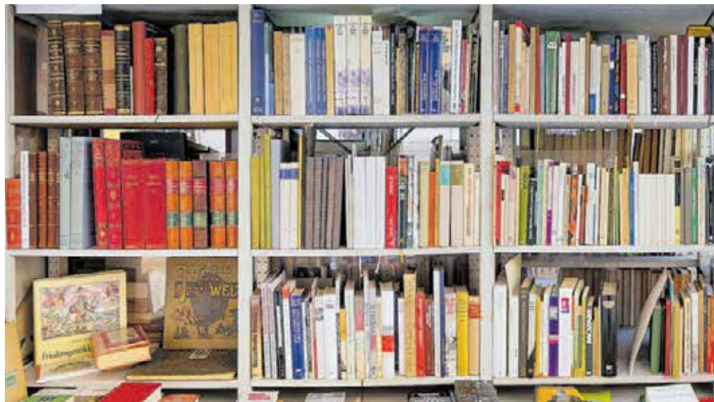
1995 erklärte die UNESCO den 23. April zum »Welttag des Buches«, den weltweiten Feiertag für das Lesen, für Bücher und die Rechte der Autoren.

Doch gerade jetzt, wo alles so anders ist, sind Konstanten wichtig. Und genau darum feiert die Stadtbibliothek Chemnitz mit all ihren Besuchern, Kunden und Followern den Welttag des Buches. Genauer gesagt, virtuell auf Facebook und Instagram. Kommen also die Besucher zurzeit