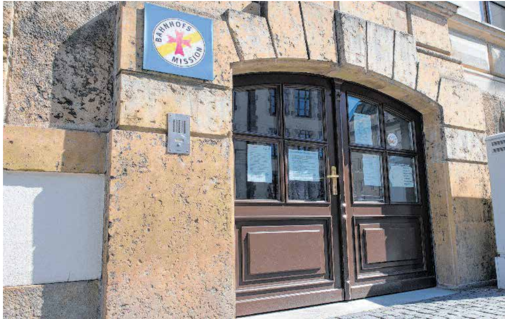
Ein Anlaufpunkt für wohnungslose Chemnitzerinnen und Chemnitzer ist die Chemnitzer Bahnhofsmission, direkt am Hauptbahnhof.

Bernsdorfer Str. 33, 09126 Chemnitz ☎ 0371 / 3347407 E-Mail: mshd@vip-chemnitz-ev.de