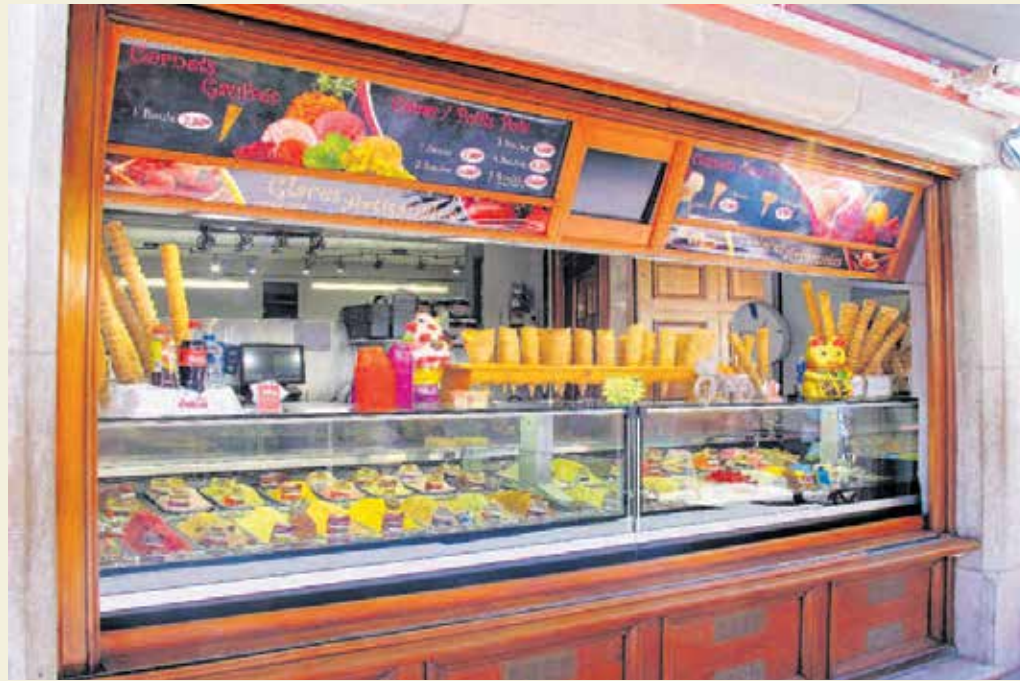
Kioske dürfen öffnen, Straßenverkauf ist erlaubt. Aber auch hier gilt selbstverständlich: Abstand halten!

Der Besuch muss mit dem Jugendamt abgestimmt werden. Ein triftiger Grund kann zum Beispiel sein,