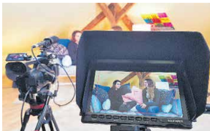
Filme »Made by You« gesucht. Alle bis 18 Jahre können mitmachen. Die besten selbst produzierten Filme nehmen am 25. Internationalen Filmfestival SCHLINGEL teil.

Das Internationale Filmfestival für Kinder und junges Publikum SCHLINGEL sucht von Kindern und Jugendlichen selbst produzierte Filme, die während der diesjährigen Festival-Edition vom 10. bis 17. Oktober auf großer Leinwand im Cine-Star in der Galerie Roter Turm gezeigt werden.