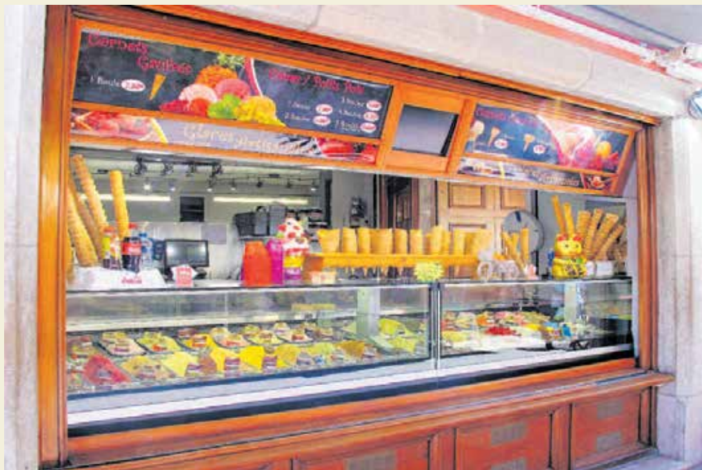
Kioske dürfen öffnen, Straßenverkauf ist erlaubt. Aber auch hier gilt selbstverständlich: Abstand halten!

Der Besuch muss mit dem Jugendamt abgestimmt werden. Ein triftiger Grund kann zum Beispiel sein,