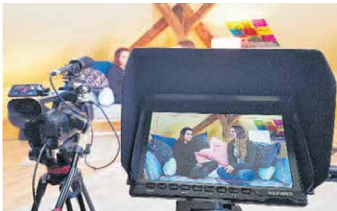
Filme »Made by You« gesucht. Alle bis 18 Jahre können mitmachen. Die besten selbst produzierten Filme nehmen am 25. Internationalen Filmfestival SCHLINGEL teil.

Das Internationale Filmfestival für Kinder und junges Publikum SCHLINGEL sucht von Kindern und Jugendlichen selbst produzierte Filme, die während der diesjährigen Festival-Edition vom 10. bis 17. Oktober auf großer Leinwand im Cine-Star in der Galerie Roter Turm gezeigt werden.