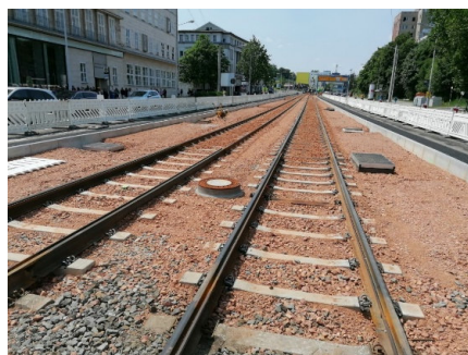
Abschnitt Falkeplatz – Reichsstraße