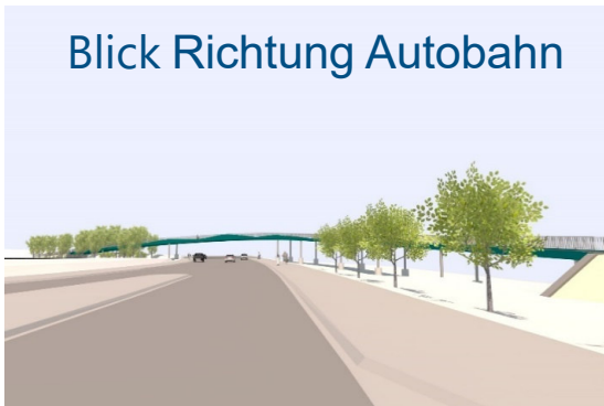
Blick Richtung Autobahn