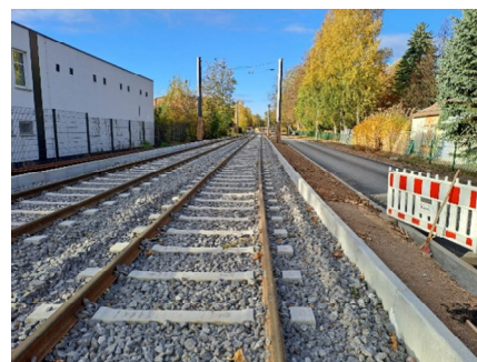
Abschnitt Am Feldschlösschen – Guerickestraße