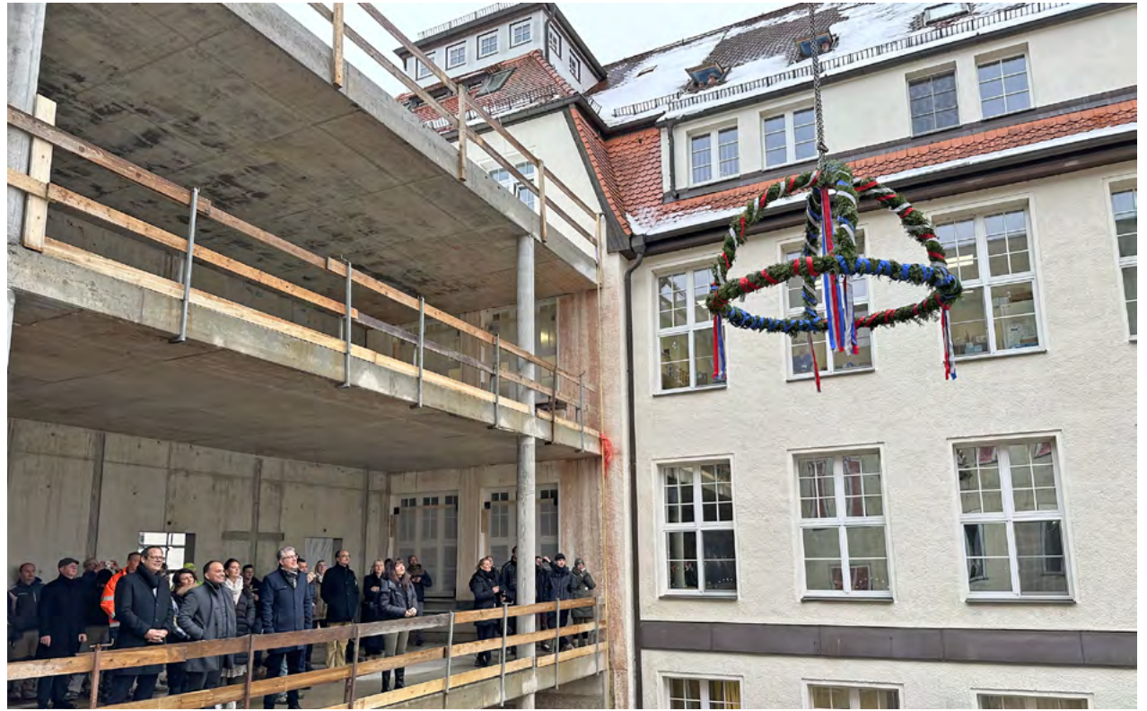
Am Standort Küchwald wird 2025 ein neues Zentrum für Herzpatientinnen und -patienten eröffnet.