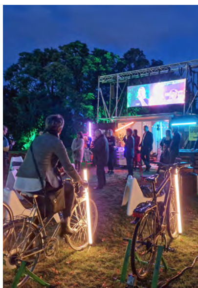
Das legendäre Fahrradkino startete zunächst als Mikroprojekt.

Die Einreichung der Projektideen erfolgt über eine Online-Plattform. In Ausnahmefällen ist nach Rücksprache die Einreichung auch per Post oder per E-Mail möglich. Die Projekte werden von einer achtköpfigen Jury begutachtet und nach definierten Kriterien bewertet. Im