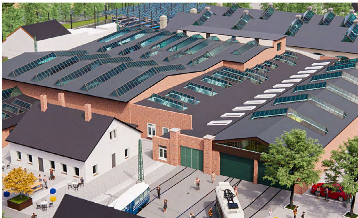
Der Stadtrat hat beschlossen, den Ausbau des Garagen-Campus mit weiteren zwei Millionen Euro zu fördern.