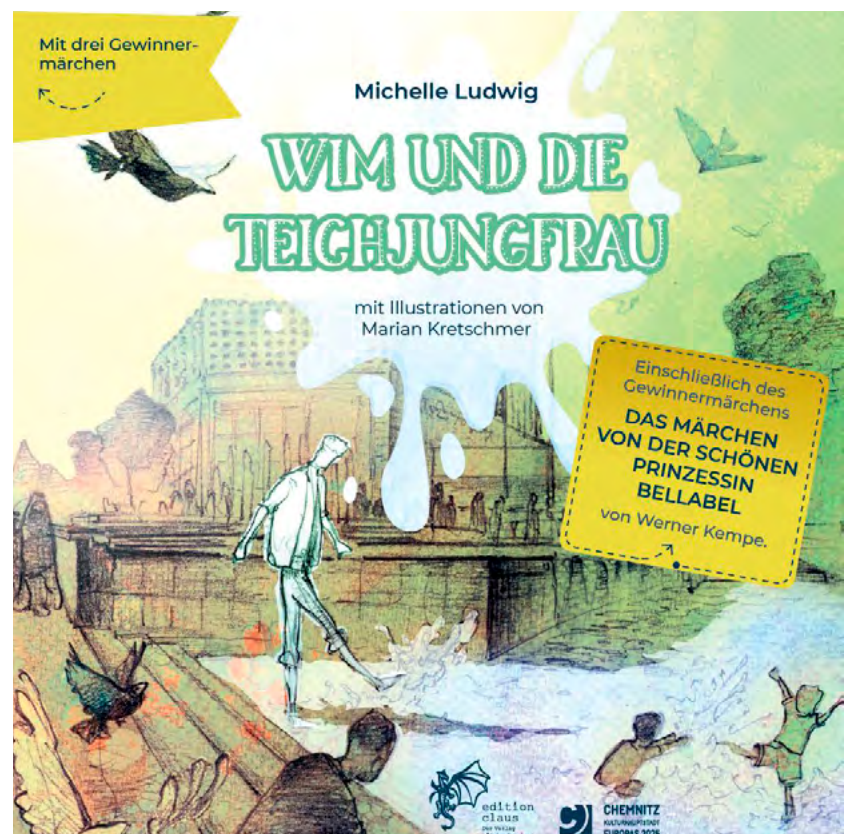
So sieht das dritte Chemnitzer Märchenbuch aus.