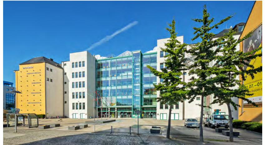
Bereits zum sechsten Mal bietet das Tietz mit dem Marktplatz für Kultur und Schule eine Plattform für kulturelle Bildung.

Die Veranstaltung möchte Kooperationen zwischen Kultureinrichtungen, Künstlerinnen und Künstlern sowie Schulen und Bildungseinrichtungen befördern und unterstützen, um kulturelle Bildung in Chemnitz zu stärken. Kulturakteurinnen und -akteure können Lehrerinnen und Lehrer von Chemnitzer Schulen kennenlernen, um ein konkretes Kulturangebot, künstlerisches Projekt oder Ideen für eine Zusammenarbeit vorzustellen.