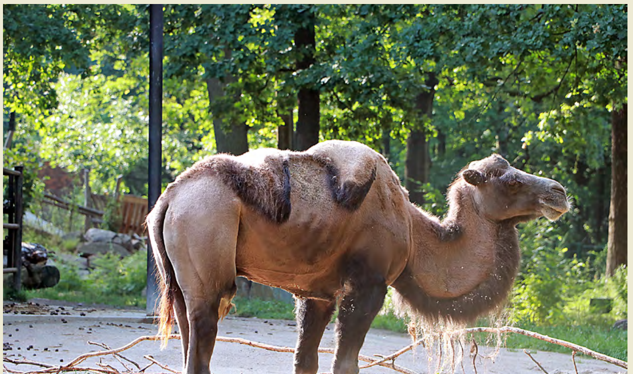
Wenn Hengst Dschingis ungünstig dasteht, kann der Betrachter in der Tat annehmen, er habe keine Höcker, besonders wenn er sich neben Stute Merle aufhält.