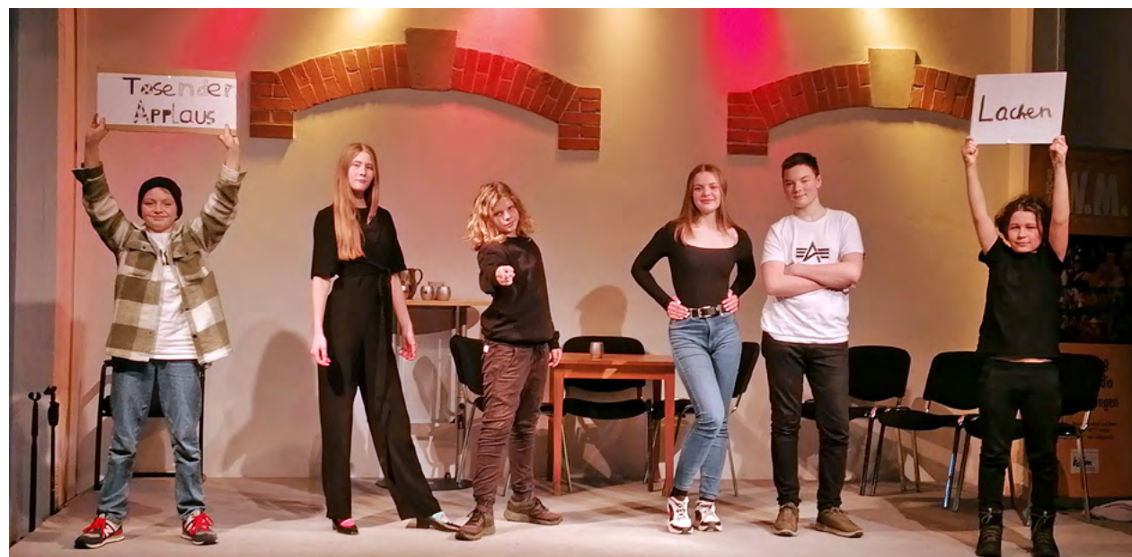
Die Klassen 7 des Chemnitzer Schulmodells treten mit der Eigenproduktion »Our criminal minds« auf.