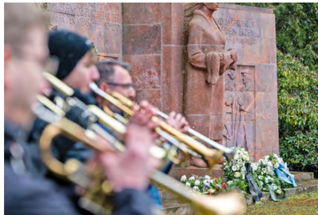
Die Kranzniederlegung auf dem Städtischen Friedhof ist traditionell der Auftakt zum Chemnitzer Friedenstag.