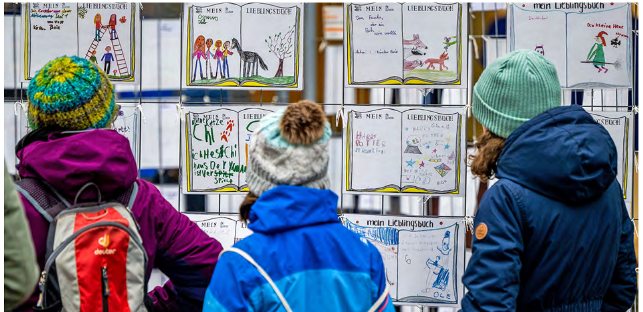
Wie Kinder sich eine Welt voller Frieden vorstellen und welche Wünsche sie für die Zukunft haben, das konnten die Menschen zum Friedenstag bei einer der Ausstellungen auf dem Neumarkt erfahren.

Der Lauf-KulTour e. V. und der Stadtsportbund Chemnitz e. V. starteten auf