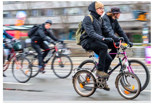
Sportlich für den Frieden unterwegs waren die Teilnehmerinnen und Teilnehmer der Radparade.

dem Neumarkt das Projekt »Friedenszeichen«. Die Läuferinnen und Läufer zeichneten in sportlichen zehn Kilome-