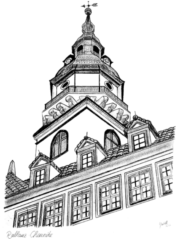
Der Turm des Alten Rathauses.

Öffnungszeiten des Rathauses: Montags bis donnerstags: 8 bis 18 Uhr Freitags: 8 bis 16 Uhr (außer an Feiertagen)