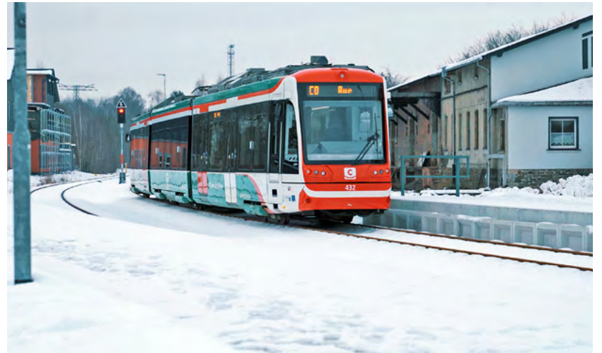
Mehr als 5.000 Fahrgäste nutzen die Strecke zwischen Aue und Chemnitz täglich.

Täglich nutzen rund 5.200 Fahrgäste die Verbindung zwischen Aue und Chemnitz. VMS-Geschäftsführer Mathias Korda freut sich: »Das ist eine stolze Zahl und mindestens eine Verdopplung der Zahl der Fahrgäste durch die Direktanbindung an die Chemnitzer Innenstadt. Wir wollen die Fahrgastzahlen aber weiter erhöhen.«