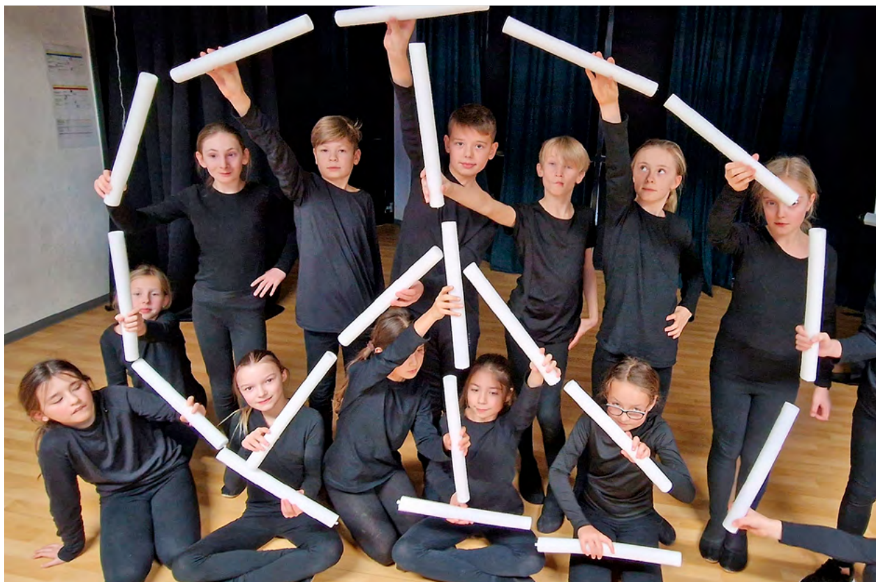
Die Schülerinnen und Schüler der BIP Kreativitätsschule zeigen das Stück »Wunder« zur Eröffnung der 25. Chemnitzer Schultheaterwoche am 27. März im Spinnbau.

Was passiert mit einer Zeitmaschine, die im Flug das Gestern, Heute und Morgen zusammenführt, fragen die Darstellerinnen und Darsteller der Martin-Andersen-Nexö-Oberschule Zschopau. Die Schülerinnen und Schüler des Matthes-Enderlein-Gymnasiums Zwönitz begeben sich in ihrem Stück in das Jahr 2222, suchen nach der Klimakatastrophe nach einem anderen bewohnbaren Planeten. Die Theatergruppe des Karl-Schmidt-Rottluff-Gymnasiums Chemnitz beschäftigt sich mit Hamlets Kindheit und Jugend und die Gruppe »Fäustlinge« des Johann-Wolfgang-von-Goethe-Gymnasiums zeigt mit »Faust 2020« eine Version des Klassikers. Außerdem bereichern Märchen, Sagen, eine Traumschiff-Satire und ein Krimi das Programm. Der Austausch unter den jungen Mimen im Alter zwischen 6 und 20 Jahren soll zur Jubiläumsausgabe besonders intensiv gepflegt werden. Gleich zu Beginn gibt es Workshops zum Kennenlernen, zum Feiern extra eine Schultheaterparty und einen Aufruf, an die Highlights, Glücksmomente wie auch Pannen der letzten Jahre zu erinnern und sie wieder lebendig werden zu lassen.