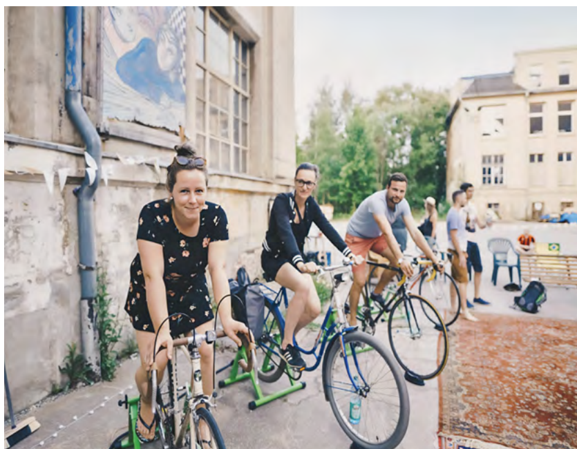
In die Pedale treten fürs Fahrradkino oder Party in der Bahn: Das waren Mikroprojekte früherer Bewerbungsrunden.