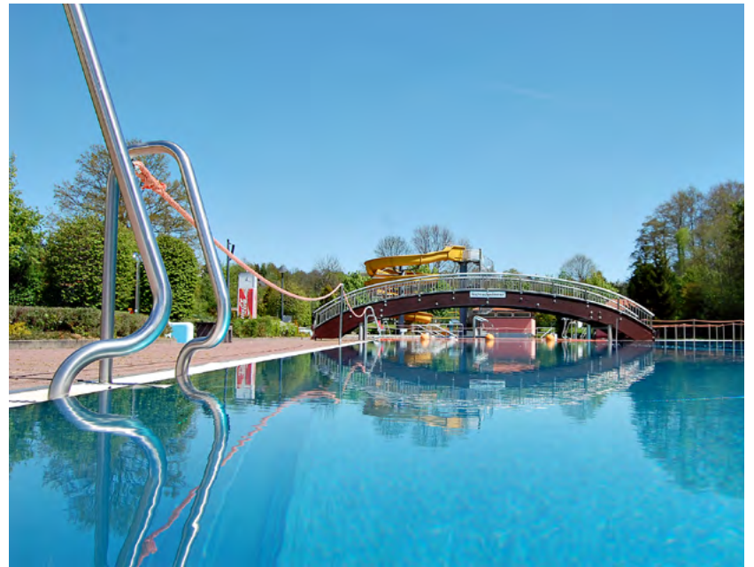
Auch die städtischen Freibäder wie das Gablener Freibad sind wieder mit Veranstaltungen im Ferienkalender dabei.

Mit der Zusammenstellung der täglichen Veranstaltungen, den mehrtägigen Angeboten wie Camps und Kursen sowie weiterer Freizeittipps bietet der Ferienkalender einen schnellen Überblick, was in Chemnitz und in der Umgebung los ist. Die Stadt gibt den Ferienkalender seit 2006 heraus, er erscheint in einer Auflagenhöhe von 6.000 Exemplaren. Für nähere Informationen steht das Jugendamt per E-Mail an jugendamt.medienarbeit@stadt-chemnitz.de oder telefonisch unter 0371 488-5667 zur Verfügung.