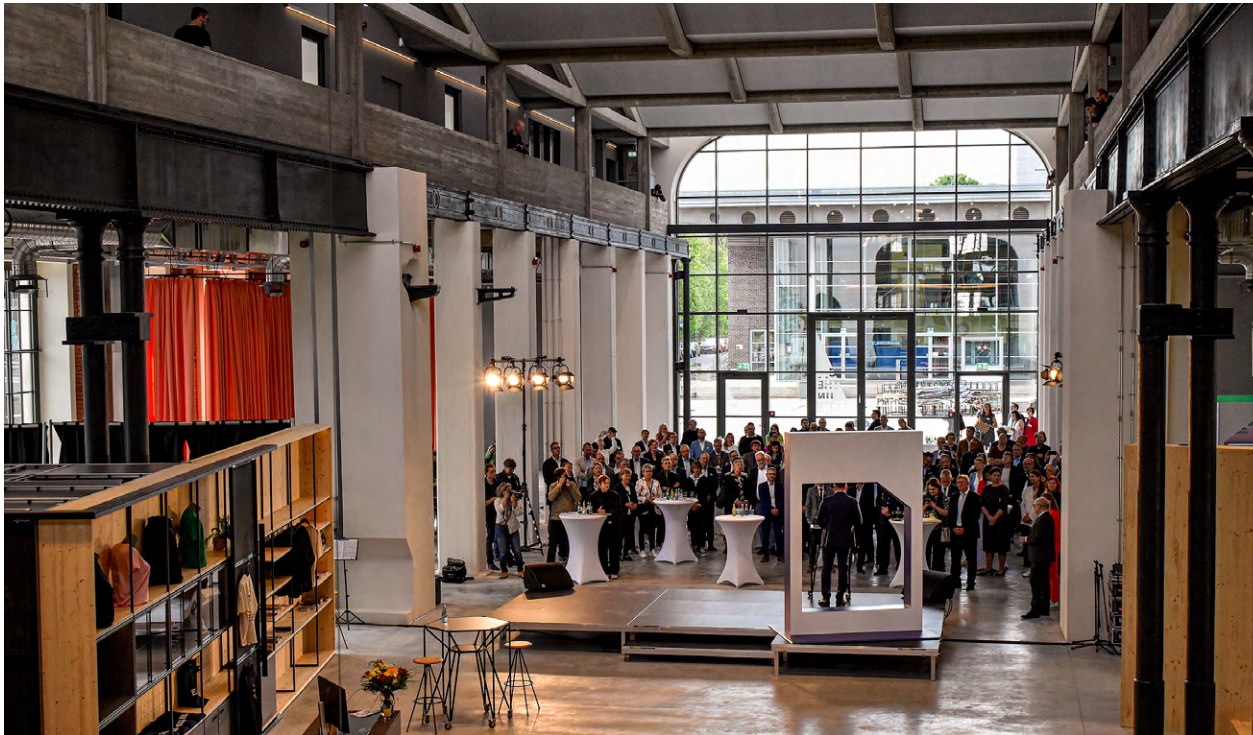
Die Hartmannfabrik ist das Herzstück der Kulturhauptstadt Europas Chemnitz 2025.