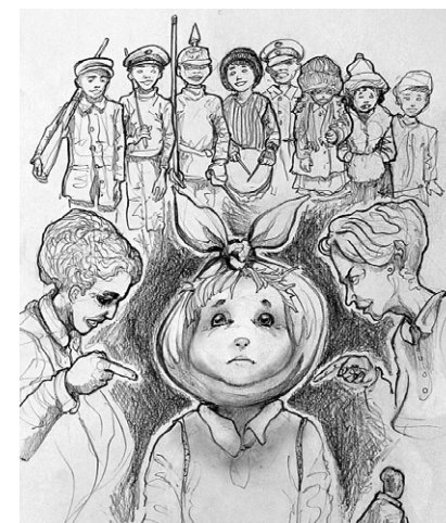
Die Bilder aus der Graphic Novel »Die sieben Leben des Stefan Heyms« werden in der Ausstellung »Stefan Heym entdecken« bis zum 16. Juni gezeigt.