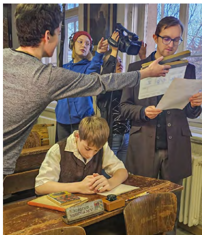
Chemnitzer Schülerinnen und Schüler wandelten auf Stefan Heyms Spuren von Chemnitz nach Prag und Berlin.