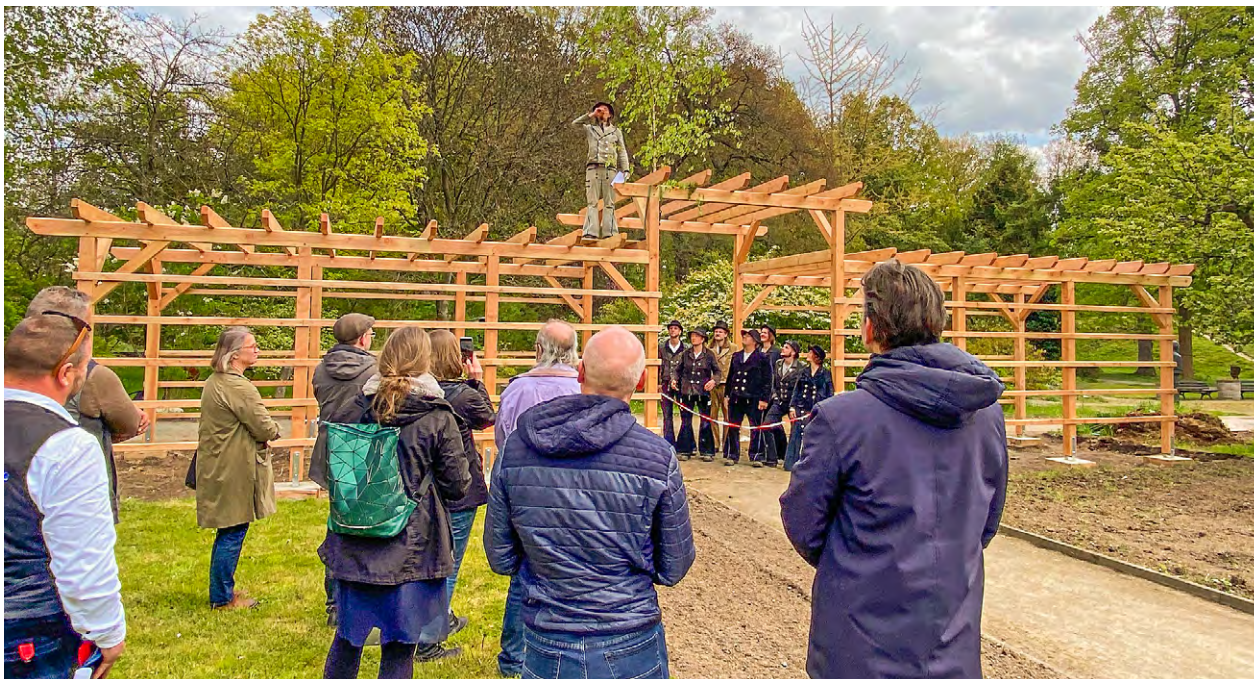
Die alte Pergola war verfallen und musste daher erneuert werden. Die neu gebaute Pergola wurde am 26. April mit einem traditionellen Richtspruch eröffnet. Fotos: Sommerbaustelle 2025