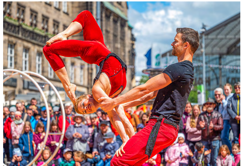
Beim Hutfestival zeigen Straßenkünstlerinnen und -künstler ein ganzes Wochenende lang ihr Können.

Akrobatisch wird es bei der Seiltanzshow vom Rope Theatre aus Köln. Das Schlappseil wird neben dem Roten Turm gespannt – das Areal um das älteste Wahrzeichen der Stadt wird erstmals als weitere Spielfläche ins Festival integriert. Die musikalische Unterhaltung kommt in diesem Jahr unter an-