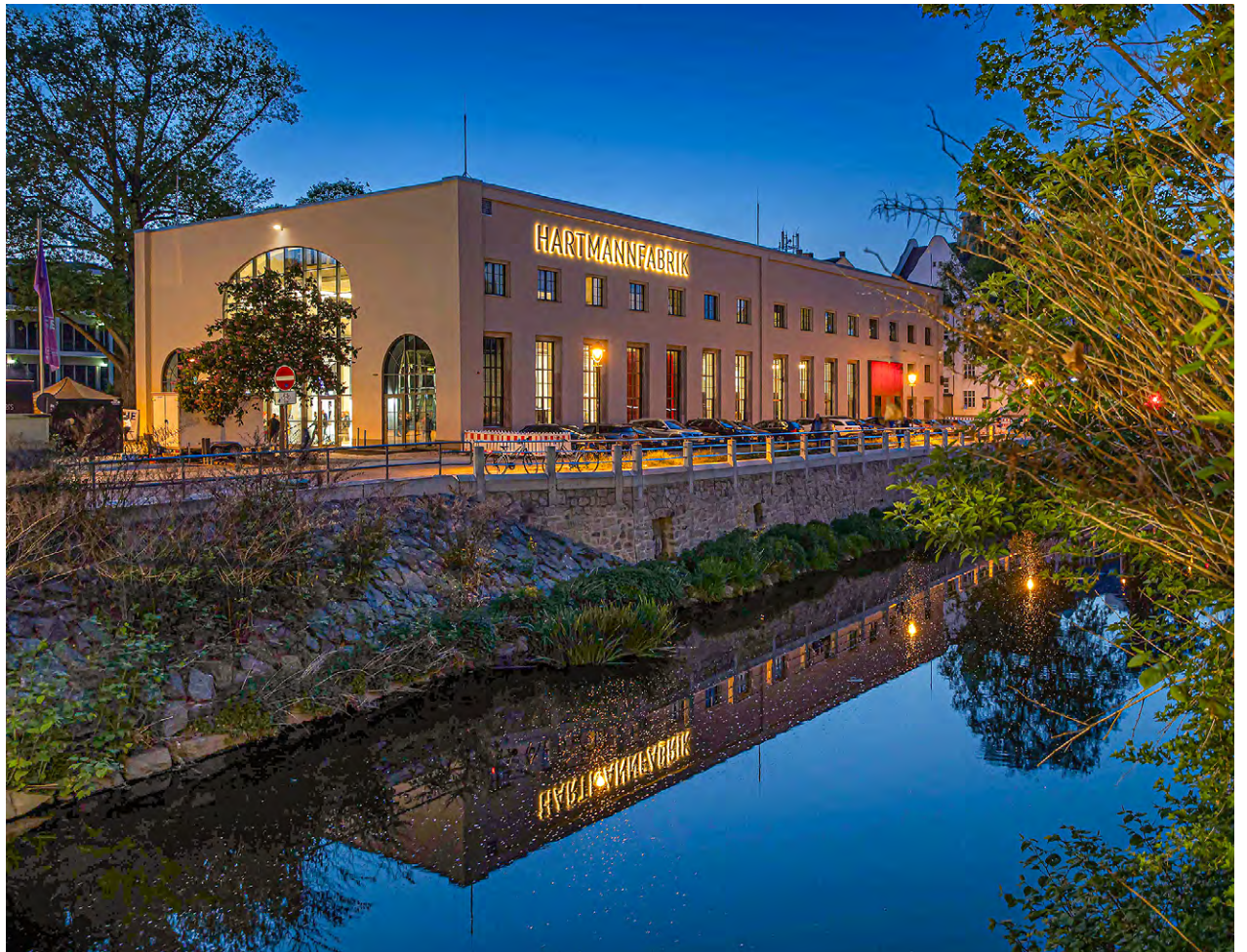
Die Hartmannfabrik in der Innenstadt wird 2025 der zentrale Anlaufpunkt für alle nationalen und internationalen Gäste.