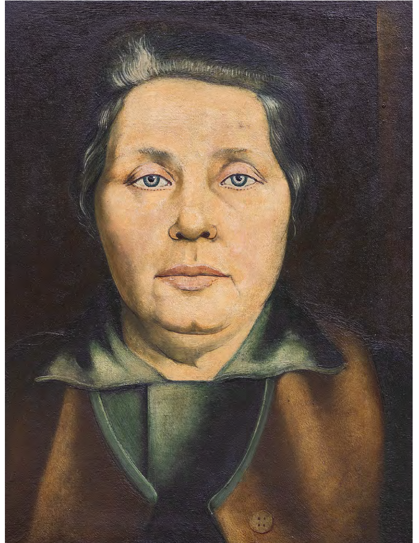
Ernst Thoms: Meine Mutter, 1928; Museum Nienburg/Weser. Foto: Museum Nienburg/Weser/Maciej Michalczyk; © Nachlassverwalter M. Allnoch

Die Ausstellung nimmt den Kerngedanken des Diskurses zur Zeit der Weimarer Republik in den Fokus und betrachtet ihn kritisch. Heute wird dieses Denken häufig als Kategorisierungs- und Typisierungswahn einer orientierungssuchenden Epoche bewertet. Jedoch kann schnell festgestellt werden, dass viele Stereotype und Klischees von damals bis in die Gegenwart nachwirken und weiter-