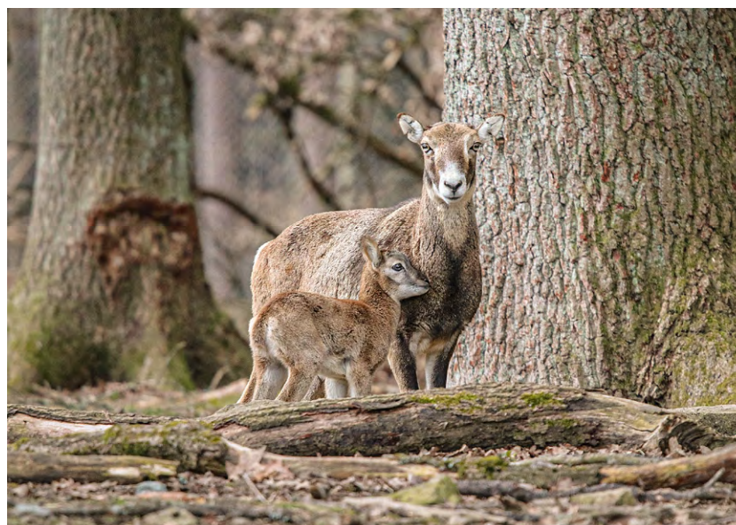
Im Wildgatter Oberrabenstein gibt es insgesamt drei Jungtiere bei den Mufflons, dem einzigen Wildschaf Europas.