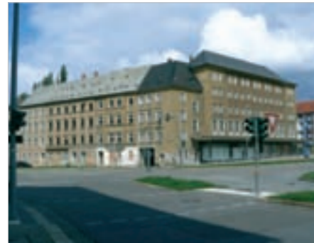
Wohnungsleerstand in der Fritz-Reuter-Straße

Im Stadtteil befinden sich gegenwärtig ungefähr 7.250 Wohnungen. Davon gehören ca. 3.000 Wohnungen zum Bestand der GGG, 750 Wohnungen sind im Eigentum der CAWG. Die verbleibenden 3.500 Wohnungen befinden sich in privatem Eigentum.