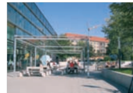
Studentisches Wohnen am Thüringer Weg