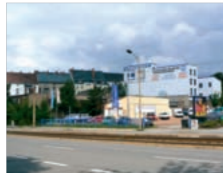
Brachflächen an der Bernsdorfer Straße