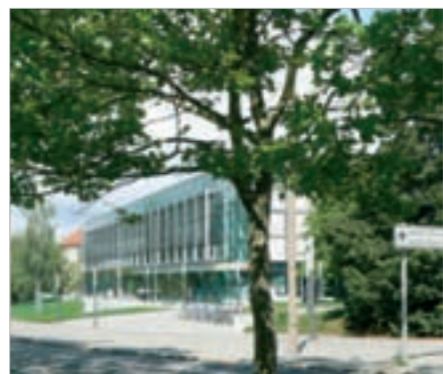
Mensa an der Reichenhainer Straße