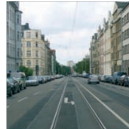
Geplante Aufwertung der Bernsdorfer Straße mit Straßenbäumen

Die Verbindung der beiden Bereiche des Stadtteils - südliches Zentrum und Bernsdorf - als Kommunikations- und Aufenthaltsraum wird durch die Reichenhainer Straße, Bernsdorfer Straße und in Fortsetzung durch die Reitbahnstraße geschaffen. Diese Straßenverbindung soll als zentrale Achse alle Funktionen der Versorgung und des öffentlichen Nahverkehrs erfüllen. Hier kann sich ein begrünter, verkehrsberuhigter Straßenraum entwickeln.