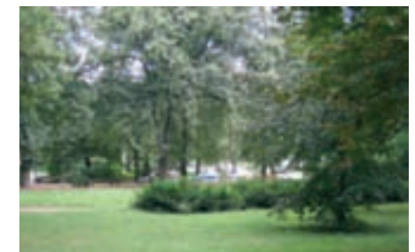
Spielbereich am Rosenplatz