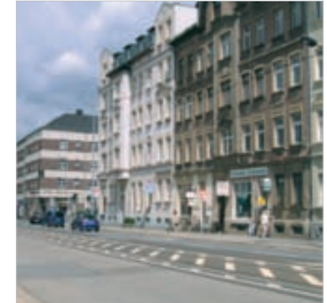
Attraktive Einkaufsmöglichkeiten durch zukünftige Umgestaltung

Dieser wird abschnittsweise Flaniermeile mit Einzelhandels- und Dienstleistungseinrichtungen, grüner Kommunikations- und Aufenthaltsort und Freizeit- und Erholungszone. Außerdem kann die Verbindung und Verflechtung von Universität und Stadt verbessert werden.