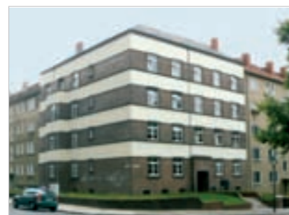
Wohnbebauung der 1930er Jahre