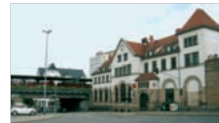
Urbanes Umfeld am Südbahnhof geplant