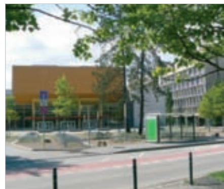
Am neuen Hörsaalgebäude der Universität

der Campus in seiner Funktion als Kommunikations- und Verbindungsbereich die stark frequentierte Straße. Dies ist als Vorzug für die Vernetzung von Stadt und Universität zu sehen und soll durch verkehrsgestalterische Maßnahmen unterstützt werden.