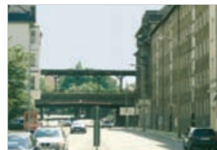
Chancen für studentisches Wohnen an der Reichenhainer Straße

gen von Studenten belegt, allerdings erschwert die Konkurrenz der Studentenwohnheime die Vermarktung an Chemnitzer Studenten. Die Nähe zur Universität sollte es ermöglichen, diesen Anteil an der Wohnungsbelegung zu erhöhen und die Wohnlagennachteile durch geringe Mieten und bedarfsgerechte Angebote zu kompensieren. So könnte es gelingen, ein geschlossenes Straßenbild zu bewahren.