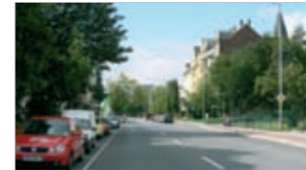
Die Zschopauer Straße - eine der radialen Verkehrsachsen

Die Eisenbahntrasse und die drei radialen Verkehrsstraßen Reichenhainer, Zschopauer und Bernsdorfer Straße gliedern das Plangebiet räumlich. Die Bahntrasse, welche die Wohnquartiere trennt, wirkt optisch sehr dominant. Deshalb kommt den „Durchbrüchen“ eine besondere Bedeutung zu.