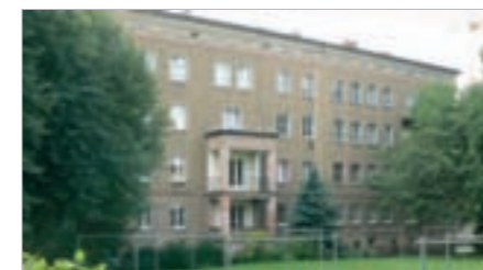
Wohnbebauung an der Reitbahnstraße - Warten auf den Sanierungsstart

Der Bereich vor dem Südbahnhof wird geprägt von zwei benachbarten, unter Denkmalschutz stehenden Unterführungen und von aus verschiedenen Richtungen einmündenden Straßen. Es entsteht eine Insel zwischen Erschließungstraßen, in der das Bahnhofsgebäude die Platzsituation bestimmt und eine Aufwertung erfahren sollte.