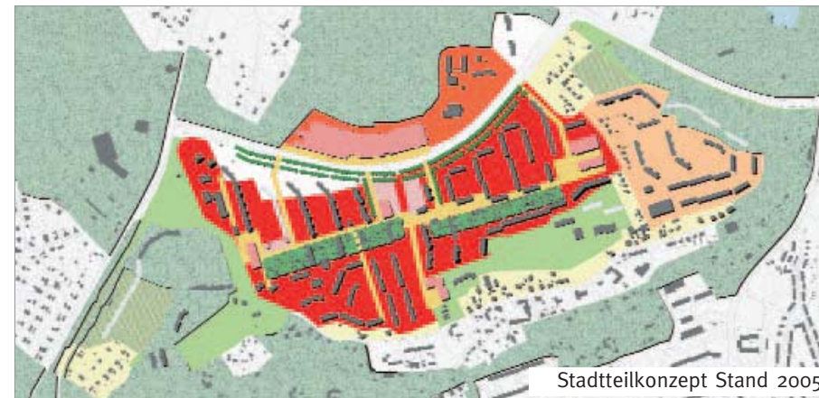
Stadtteilkonzept Stand 2005

um dem Süden von Chemnitz mit Mitteln des Stadtumbaus eine neue Perspektive zu geben, die Vorzüge des Stadtteils zu stärken und die Nachteile zu mildern.