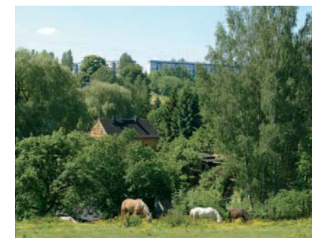
... mit Blick in die Natur