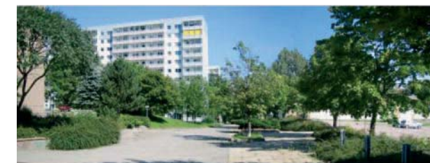
Ein schöner stiller Grünraum ...