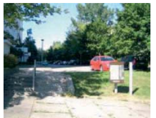
... jedoch mit baulichen Mängeln

Die wichtigsten funktionalen und gestalterischen Mängel können dabei beseitigt und eine bessere Benutzbarkeit für alle Bewohner erreicht werden. Ziel ist die barrierefreie und großzügige Einbindung aller Wohnerschließungsstraßen und der horizontal verlaufenden Gehwege in die zentrale Fußgängerachse. Die Fußgängerachse wird belebter und in charakteristische Teilabschnitte gegliedert; auch Rollstuhlbewohner und Muttis mit Kinderwagen finden so einen problemlosen Einstieg in den Weg. Durch kleine,