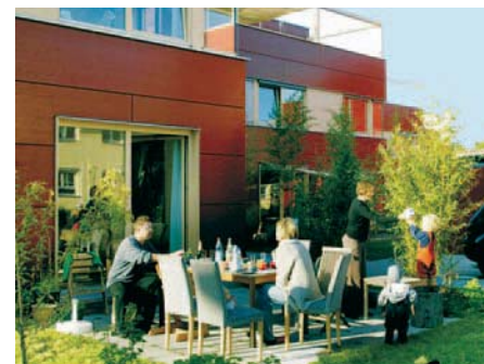
Frühstück auf der Terrasse ...