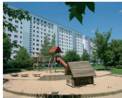
... und familienfreundliches Wohnumfeld