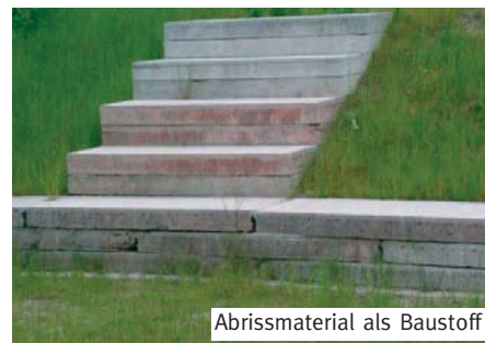
Abrissmaterial als Baustoff