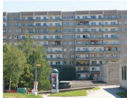
... und leerstehende Wohnungen