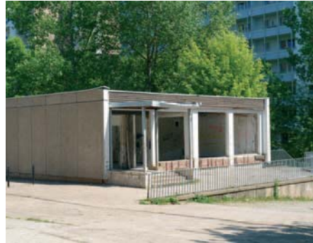
Leerstehende Gebäude der Infrastruktur ...

Der Stadtteil ist in Bewegung geraten. Neben umfangreichen Maßnahmen zur Sanierung der Wohngebäude und zur Aufwertung des wohnungsnahen Freiraums wurde in unmittelbarer Nachbarschaft das Vita-Center realisiert, das heute nicht nur den kommerziellen Mittelpunkt des Chemnitzer