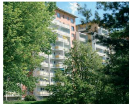
Neue Wohnqualität ...