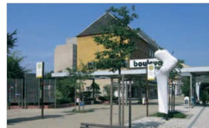
Eingang zum Brühl-Boulevard

und Sportstätten. Die Technische Universität, das Stadtbad sowie die Kulturfabrik Schönherr komplettieren das attraktive Angebot. ■ Mit der Oper und den Städtischen Kunstsammlungen befinden sich zwei der wichtigsten kulturellen Einrichtungen der Stadt im Gebiet. Das historische Schloßbergviertel mit Schloßkirche, Schloßbergmuseum und vielen Restaurants ist ebenfalls auf kurzem Wege erreichbar.