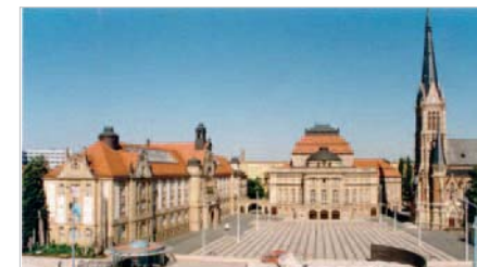
Kunst und Kultur in der Nähe - am Theaterplatz

Der Stadtteil bietet in mehrerlei Hinsicht Highlights der Stadt. Der nach 1990 neugestaltete Theaterplatz ist heute wieder einer der kulturellen Schwerpunkte der Stadt. Der Brühl-Boulevard, in den 1970er Jahren zum Fußgängerboulevard umgebaut, bereichert die Einkaufswelt des Zentrums. Die neue Gestaltung des Bus-