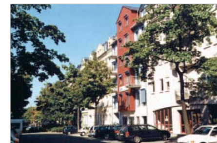
Lückenschließung in der Elisenstraße