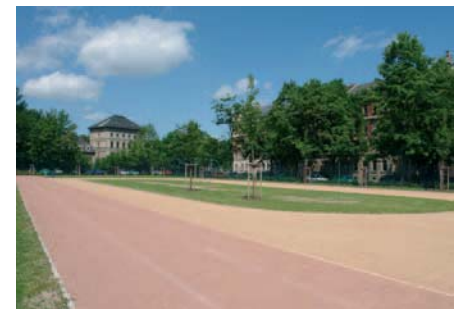
Sportanlage auf einer Rückbaufläche

Neben der Stabilisierung der geschlossenen Blockstrukturen – insbesondere im Bereich des Brühl-Boulevards – gilt es für vorhandene und zukünftige Brachflächen neue Nutzungen zu finden. Im Karree zwischen Haubold-, Elisen- und Mühlenstraße, in dem für das Wohnen in den fast vollständig leerstehenden Gebäuden keine Chance gesehen wurde, trägt die neue Freiflächennutzung in Form einer Sportanlage und eines Hortgartens zur Aufwertung des Stadtteils bei.