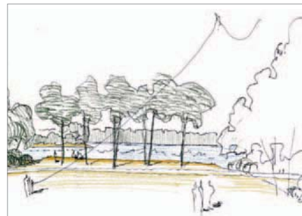
Lichtung im Uferpark

zwischen Stadtpark und Schloßteich stellt ein bedeutendes Erholungspotenzial der Stadt dar und bietet die Möglichkeit zur Entwicklung einer multifunktionalen Grün- und Freiraumachse, die die gesamte Innenstadt durchzieht.