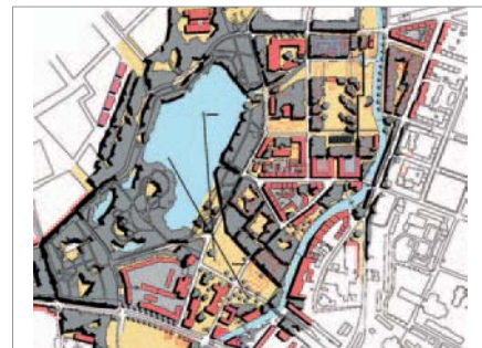
Uferpark zwischen Chemnitz und Schloßteich