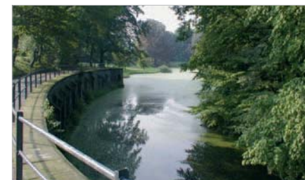
Ruhe und Entspannung im Schönherrpark