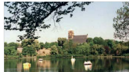
Aktive Erholung auf dem Schloßteich