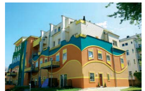
Hofbebauung der besonderen Art