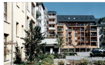
Neugestalteter Innenhof im Karree an der Lerchenstraße