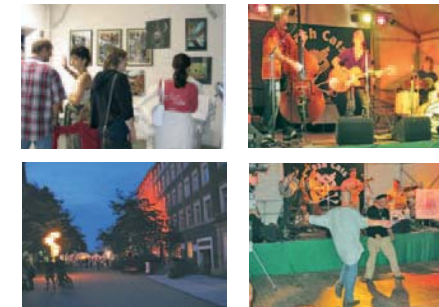
Impressionen vom Stadtteilstfest 2005