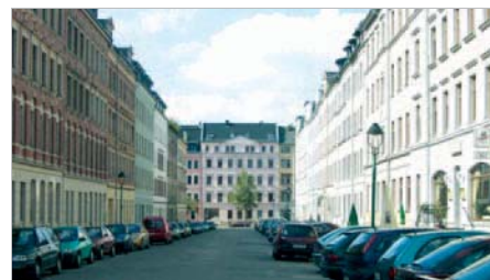
Sanierter Abschnitt in der Heinrich-Zille-Straße