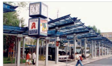
Der Busbahnhof - ein Beispiel für moderne technische Infrastruktur

bahnhofs trägt zur aktiven Wahrnehmung der Vorzüge unserer Stadt bei. Die Architektur der Gründerzeit und die Grünräume mit dem eindrucksvollen alten Baumbestand zeugen von der historischen Kontinuität der Entwicklung des Stadtbildes.