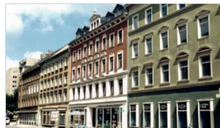
Gute Geschäftslage an der Georgstraße

strengungen hat sich die Einwohnerzahl in den letzten Jahren deutlich reduziert. Andererseits stellt sich das Gebiet als ruhiger, sehr gut erschlossener und ausgestatteter Wohnstandort in unmittelbarer Zentrumsnähe dar.