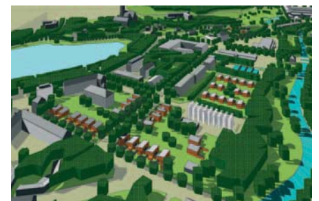
Umstrukturierungsbereich "andere Wohnformen" Ausschnitt Nordstraße