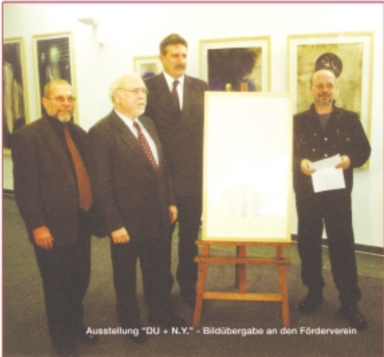
Ausstellung "DU + N.Y." - Bildübergabe an den Förderverein