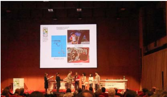
Prämierung der jungen Gewinner des Fotowettbewerbs

2011 richtete die italienische Stadt Genua die Jahreshauptversammlung aus, zu der jährlich die Mitgliedstädte von Eurocities zusammenkommen, um wichtige Entscheidungen zu treffen, das vergangene Jahr auszuwerten und über Perspektiven der Netzwerkarbeit zu befinden. Unter dem Leitgedanken „Planning for People“ („Planen für die Menschen“) diskutierten sie die Einbeziehung menschlicher Bedürfnisse in städtische Entwicklungsprozesse. Werden die Bürgerinnen und Bürger eingebunden, können Stadtteile neu gestaltet und der soziale Zusammenhalt gefördert werden. In der Bürgermeisterdebatte betrachteten die Politiker die städtische Entwicklung unter dem Gesichtspunkt der zunehmenden Einwanderung nach Europa.