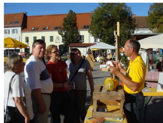
Interkultureller Austausch im österreichischen Fürstenfeld