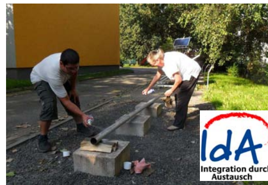
Das Projekt findet in Chemnitz und dem Landkreis Mittelsachsen statt

Mit „Perspektive? Arbeit!“ startete die solaris Förderzentrum für Jugend & Umwelt gGmbH Sachsen im Juli 2011 ein Projekt, um gesundheitlich eingeschränkten und/oder behinderten, volljährigen und arbeitslosen Menschen neue Perspektiven auf dem Arbeitsmarkt zu schaffen. Seit August 2011 bereiten sich die Teilnehmenden auf die individuellen Praktika in einem der Partnerländer Österreich oder Spanien vor. Umgesetzt wird diese Phase durch Bewerbungs- und Kommunikationstraining, Sprachkurse, interkulturelle Kurse und vorbereitende Praktika in regionalen Unternehmen. Anfang Oktober ist die erste Gruppe in Begleitung eines Fachbetreuers nach Fürstenfeld (Österreich) aufgebrochen. Vor Ort werden sie von dem Gründer- und Servicezentrum Fürstenfeld betreut. Neben der Vermittlung beruflicher Erfahrungen werden Aktivitäten zum interkulturellen Austausch organisiert. An das Praktikum schließt sich eine dreimonatige Vermittlungsphase an, in der die Teilnehmenden bei Bewerbung und Integration in den regionalen Arbeitsmarkt unterstützt werden. Das Projekt wird über das Programm „IdA – Integration durch Austausch“ durch das Bundesministerium für Arbeit und Soziales und den Europäischen Sozialfonds für Deutschland gefördert.