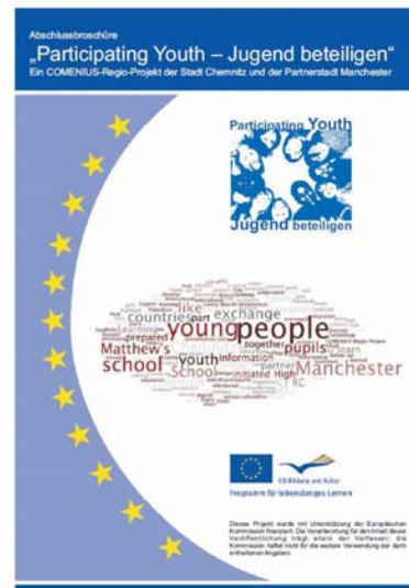
Abschlussbroschüre „Participating Youth – Jugend beteiligen“

Am 30.07.2011 wurde „Participating Youth – Jugend beteiligen“ mit der Partnerstadt Manchester erfolgreich abgeschlossen. Zur Dokumentation der Aktivitäten und Ergebnisse erstellten die Chemnitzer Partner eine Abschlussbroschüre. Ausgehend von der Entstehung des Projektes erhalten Interessierte einen Überblick über Inhalt und Partner. Die Aktivitäten auf regionaler und bilateraler Ebene finden eingehend Erläuterung. Unter der Überschrift „Ergebnisse des Projektes“ werden die Themen und Schwerpunkte der Erfahrungsaustausche zusammengefasst und mit guten Praxisbeispielen unterlegt. Daran schließt sich eine Erläuterung der Einbindung der Jugendlichen in die Besuche an. Statements der beteiligten Akteure verdeutlichen die Bedeutung des voneinander Lernens. Abschließend wird ein Blick auf bereits realisierte Folgeprojekte und auf Anknüpfungspunkte für eine weitere Zusammenarbeit geworfen. Als Anlage verfügt die Broschüre über eine englische Zusammenfassung, eine Kontaktliste der involvierten Einrichtungen sowie eine DVD mit Protokollen, Fotos und Videos zum Projektverlauf.