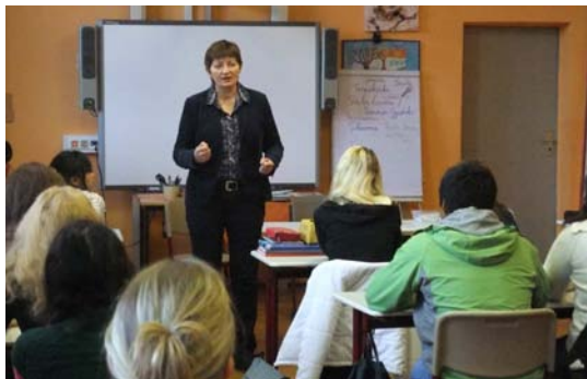
Die Jugendlichen lernen die Arbeit einer Europaabgeordneten kennen