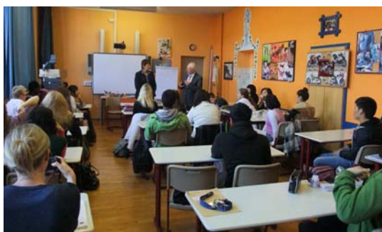
Auch zur Stellung Europas in der Weltpolitik gab es viel Informationsbedarf

Durch die Arbeit im COMENIUS-Regio-Projekt „Participating Youth – Jugend beteiligen“ wurde deutlich, dass die Erhöhung des Demokratieverständnisses junger Menschen und das Verstehen demokratischer Prozesse einer Förderung bedürfen. Eingebettet in einen längeren Prozess besuchte die Schulsozialarbeiterin des Don Bosco Hauses mit der Migrationsklasse der Georg-Weerth-Mittelschule die Chemnitzer Jugendkonferenz im September 2011. In Projekttagen mit dem Netzwerk für Demokratie und Courage Chemnitz zum Thema „Wie funktioniert Demokratie?“ beschäftigten sich die 8. und 9. Klassen mit Einflussmöglichkeiten in der Gesellschaft.