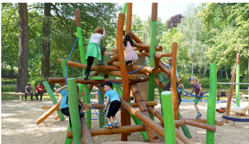
Auf dem neuen Spielplatz auf der Schloßteichinsel finden Kinder nun wieder allerlei Spielgeräte zum Klettern, Schaukeln und Balancieren.

Insgesamt belaufen sich die Baukosten für den Landschaftsbau und die Spielgeräte auf 354.000 Euro. Das Vorhaben wurde gefördert mit Städtebaufördermitteln von Bund und Freistaat Sachsen und natürlich Mitteln der Stadt Chemnitz.