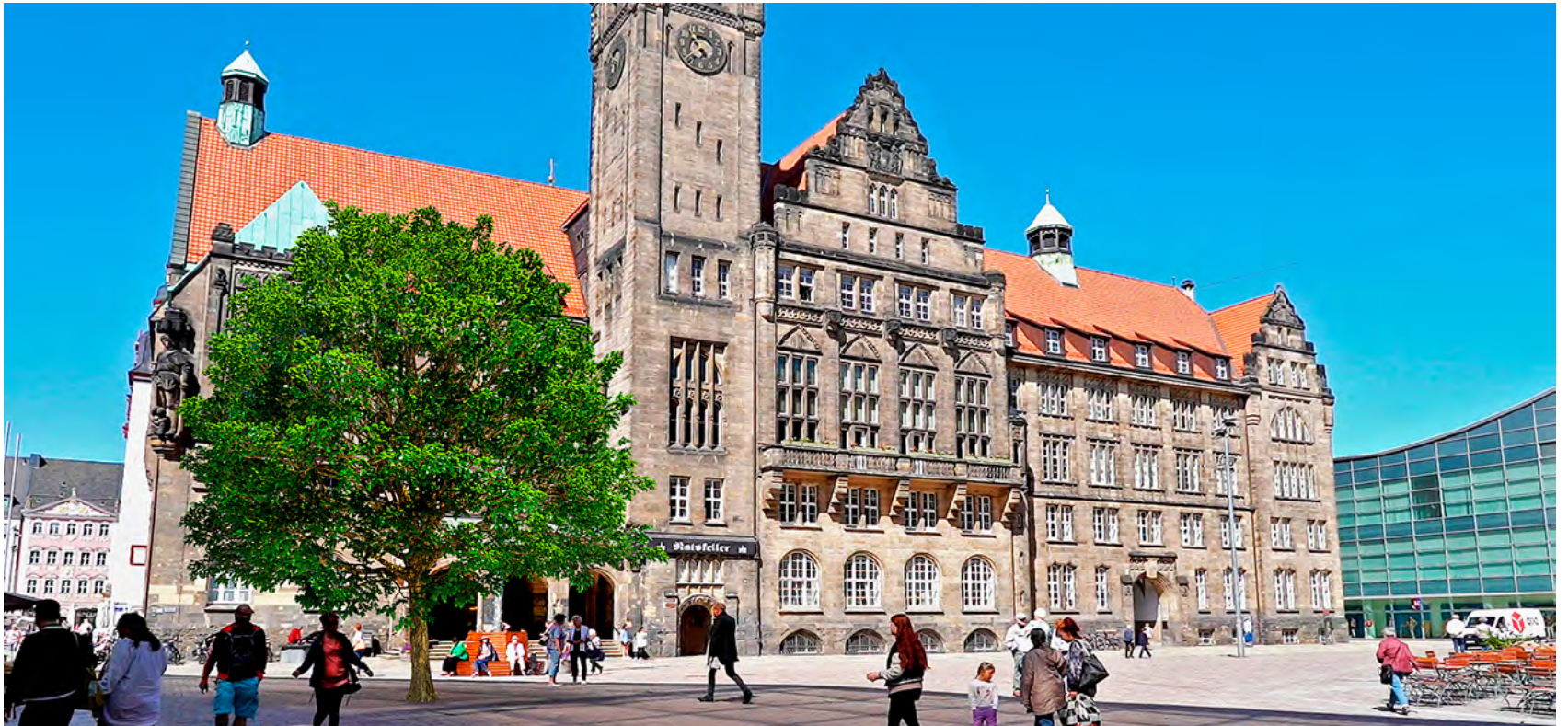
Symbolfoto: Nur wenige Flächen auf dem Markt und Neumarkt sind für einen Baum geeignet, die Planerinnen und Planer suchen derzeit nach dem richtigen Standort.

Peter Börner ist Garten- und Landschaftsarchitekt und begleitet als Leiter des Grünflächenamtes zahlreiche Baumaßnahmen der Stadt Chemnitz. Nach den Haushaltsbeschlüssen des Stadtrates im März sollen nun ein Baum auf dem Markt sowie eine Stadtmöblierung für Schlossteichpark und Insel realisiert werden.