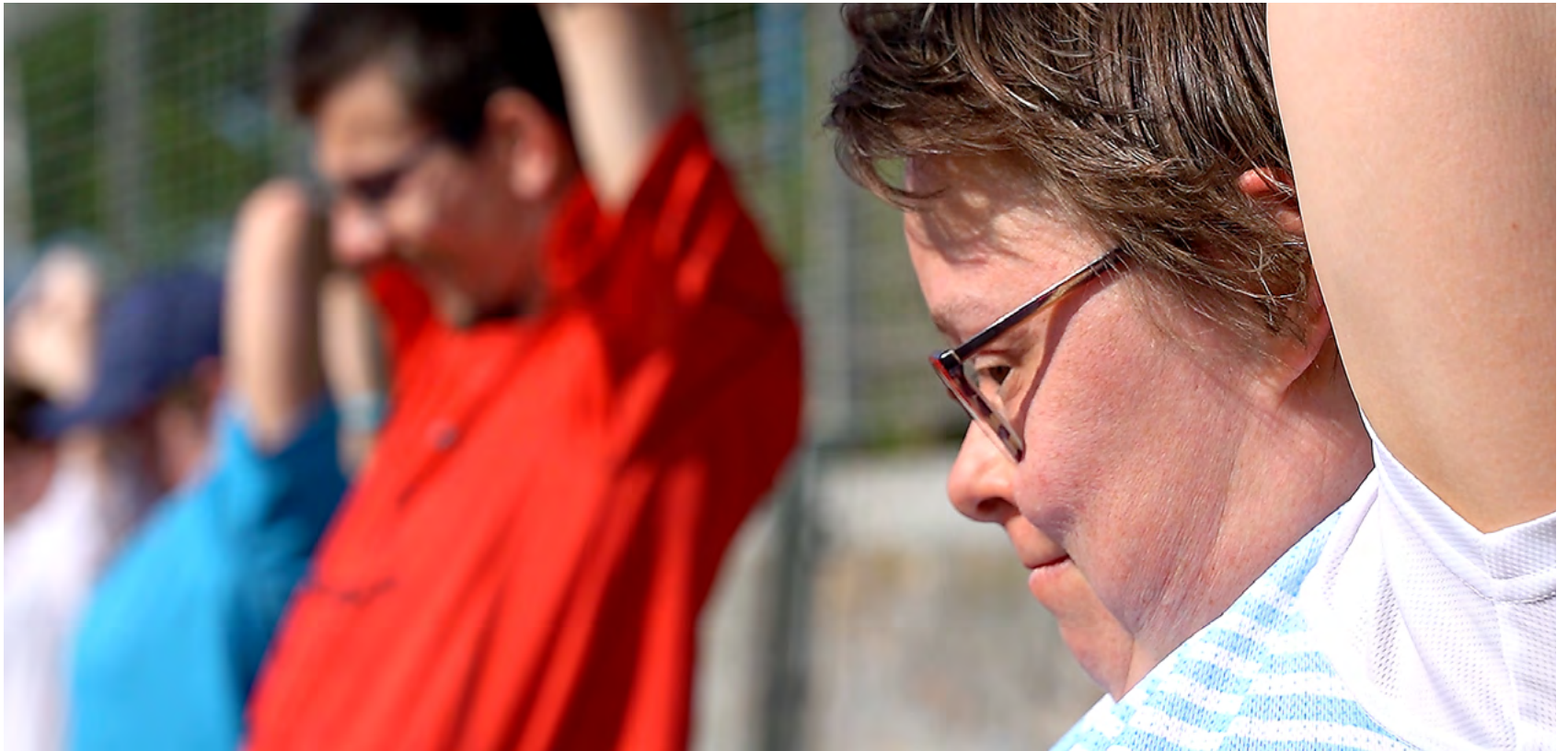
Die Sportlerinnen bereiten sich auf die Special Olympics in Berlin vor.