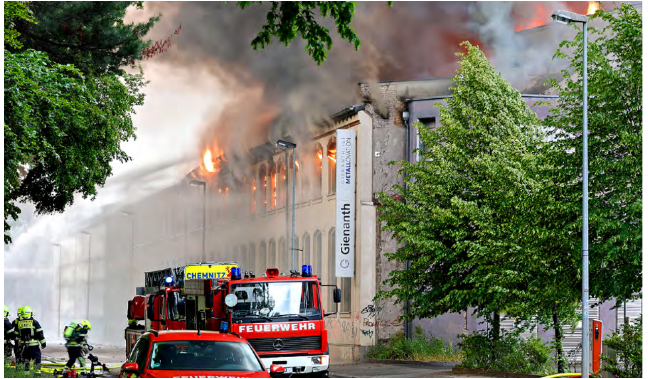
Rund 200 Kameradinnen und Kameraden der Berufs- und der Freiwilligen Feuerwehren waren im Einsatz.

In zwei Gebäudeabschnitten sorgten die Feuerwehrfrauen und -männer dafür, dass das Feuer sich nicht weiter ausbreitet oder auf andere Gebäude übergreift. Dabei mussten sie sowohl von innerhalb des Gebäudes als auch von außen über die Leiter gegen die Flammen kämpfen. Mit mehreren Kilometern Schlauchleitungen konnten die insgesamt rund 200 Einsatzkräfte bis Mitternacht die Lage unter Kontrolle bringen. Bis in den Samstag hinein hielten die Löscharbeiten an. Im Laufe des Tages konnten die Feuerwehren die letzten Glutnester löschen und daraufhin mit dem Rückbau beginnen. Auf Grund der Explosionsgefahr an der Einsatzstelle mussten umliegende Woh-