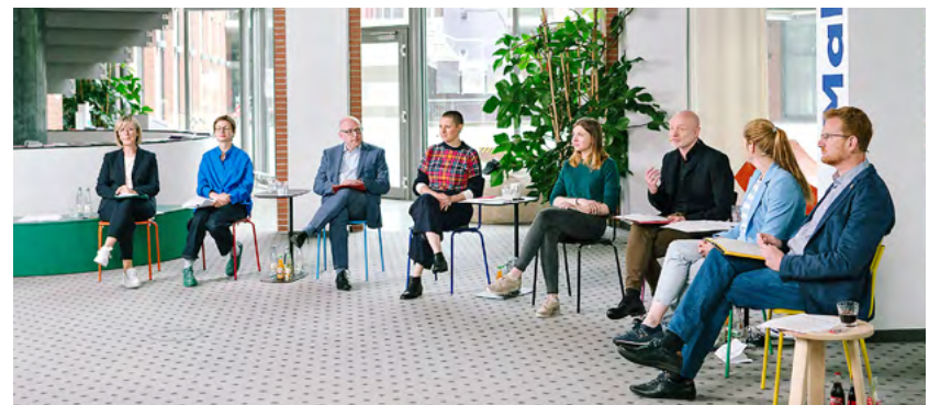
Während der virtuellen Präsentation im Sitz der Kulturhauptstadt Europas Chemnitz 2025 GmbH in der Hartmannstraße.

weiteren Aufbau der Organisation, zur Umsetzung des Narratives, zu ersten sichtbaren Aktivitäten in der Stadt und der Kulturregion, zur Beziehung zur anderen Kulturhauptstadt in 2025, Nova Gorica, zur Entwicklung der ersten Interventionsflächen, aber auch zur Vernetzung mit Akteurinnen und Akteuren sowie Partnerinnen und Partnern in Europa und in der Region. Das Monitoring dient nicht dem direkten Vergleich der Kulturhauptstädte, sondern dem Erfahrungsaustausch und