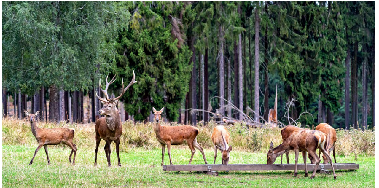
Fester Bestandteil des Wildgatters Oberrabenstein: das Rotwild.