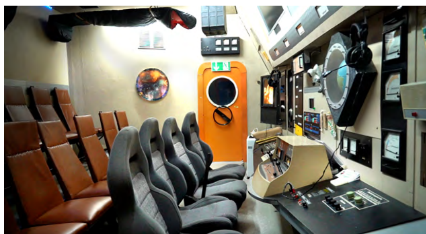
Mit einiger Raffinesse wurde eine Raumkapsel zur Simulation von Raumflügen eingerichtet. Problem: Die Technik ist aus den 70er und 80er Jahren und damit veraltet.

Seit Ende 2022 verfügt das Kosmonautenzentrum außerdem über einen eigenen Escape-Room. Die Aufgabe: durch das Lösen von Rätseln den Weg aus einer verschlossenen Raumkapsel finden. Spielerisch und erfinderisch schreibt die Einrichtung zudem jährlich