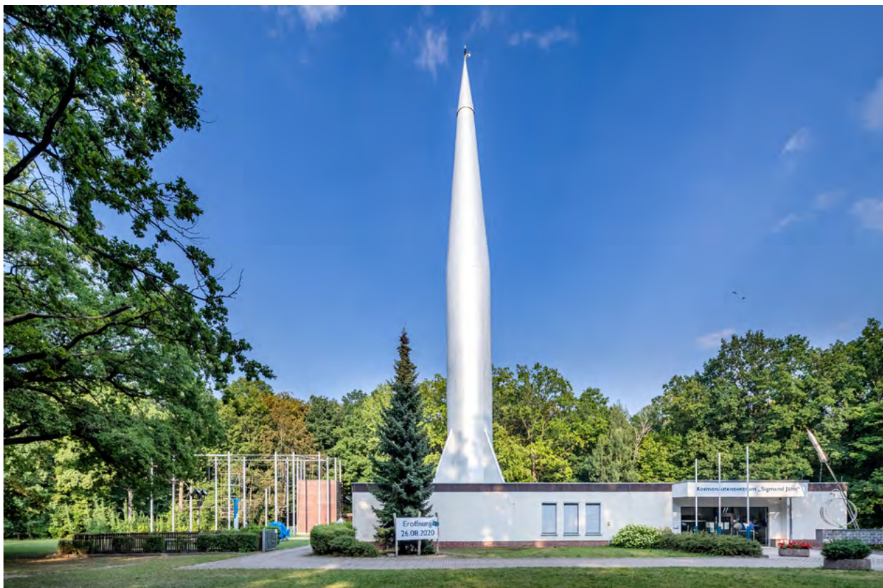
Das Kosmonautenzentrum »Sigmund Jähn« befindet sich im Kuchwald und ist aufgrund seiner imposanten Rakete bereits von Weitem zu erkennen.

Wurde das Kosmonautenzentrum räumlich immer wieder erweitert oder die Sanitäreinrichtungen 2004 grundlegend modernisiert, ist die Brandschutzanlage mittlerweile in die Jahre gekommen. Für die Modernisierung hat der Stadtrat nun 25.000 Euro eingestellt. Vorbehaltlich der Genehmigung durch die Landesdirektion Sachsen, ist die Aktualisierung der Brandschutzanlage zugleich der Beginn einer umfassenden Neugestaltung der »Raumkapsel«, die sich unmittelbar unterhalb der Rakete befindet. Hier finden die simulierten Raumflüge statt. Das Problem schildert Claus folgendermaßen: »Der Stand der Technik ist aus den 70er und 80er Jahren. Vieles funktioniert nicht mehr. Und für die Reparatur fehlt schlichtweg das Knowhow.«