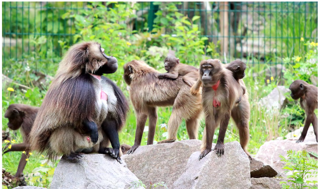
18 Dscheladas (Blutbrustpaviane) sind in den Tierpark Chemnitz gezogen.

Derzeit befindet sich die Affengruppe in der Eingewöhnung. Sie lernt die große naturnahe Anlage, die Tierpflegerinnen und -pfleger und die täglichen Abläufe kennen. Nach der Übergabe der Anlage sind die Tiere nun auch von den Besucherinnen und Besuchern sehr gut zu beobachten.