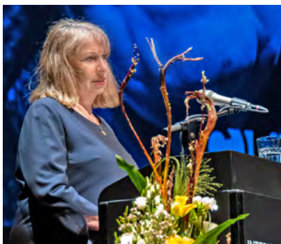
Staatsministerin Petra Köpping während ihrer Rede bei dem Festakt.

Das Kuratorium, das über die Vergabe des Preises entscheidet, würdigt mit der Verleihung an Jenny Erpenbeck eine Autorin, »die sich kritisch mit brisanten und aktuellen gesellschaftspolitischen Themen auseinandersetzt und diese in einer klaren und verständlichen, zugleich aber die Komplexität der verhandelten Probleme und Konstellationen spiegelnden Literatursprache präsentiert. Dabei verknüpft sie in ihrem Werk stets das Besondere mit dem Allgemeinen, indem sie die vielfältigen Zusammenhänge und Abhängigkeiten individueller Schicksale und Beziehungen von gesellschaftlichen und historischen Dimensionen deutlich werden lässt.« Die in Ostberlin geborene Schriftstellerin Jenny Erpenbeck schlug neben ihrer Karriere als Theaterregisseurin in Deutschland und Österreich eine Laufbahn als Schriftstellerin ein. 1999 erschien ihr Debütroman »Geschichte vom alten Kind«. Neben weiteren Romanen wie »Heimsuchung« (2008), »Aller Tage Abend« (2012), »Gehen, ging, gegangen« (2015) und »Kairos« (2021) veröffentlichte Jenny Erpenbeck Essays sowie Dramen, die sie zum Teil selbst inszenierte. Ihre Werke wurden in mehr als 30 Sprachen übersetzt. Insbesondere für ihr literarisches Schaffen wurde sie mit nationalen und internationalen Preisen, zuletzt dem Uwe-Johnson-Preis, geehrt. ■