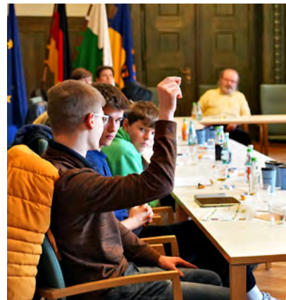
Die Jugendlichen hatten viele Ideen mitgebracht.

Während des Austauschs, zu dem die Kinder- und Jugendbeauftragte der Stadt Chemnitz, Ute Spindler, eingela-