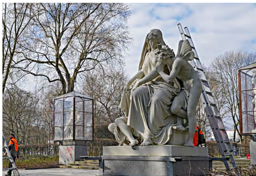
Die von Johannes Schilling geschaffenen Sandsteinfiguren »Vier Tageszeiten« am Chemnitzer Schloßteich sind von ihrem Winterschutz befreit worden. Die »Schillingschen Figuren« gehören zu den auch weit über Chemnitz hinaus bekannten künstlerisch-bildhauerischen Kleinoden. Im Jahr 1905 wurden auf der Brühlschen Terrasse in Dresden die Originale aus Postelwitzer Sandstein durch Bronzegüsse ersetzt, Chemnitz erhielt die Originale.