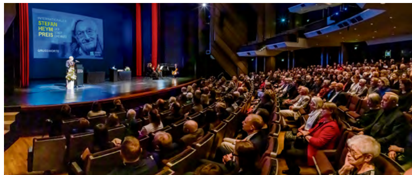
Die Preisverleihung im Opernhaus Chemnitz am Samstagabend stand allen Interessierten offen. Die Karten, die kostenfrei angeboten wurden, waren vergriffen.