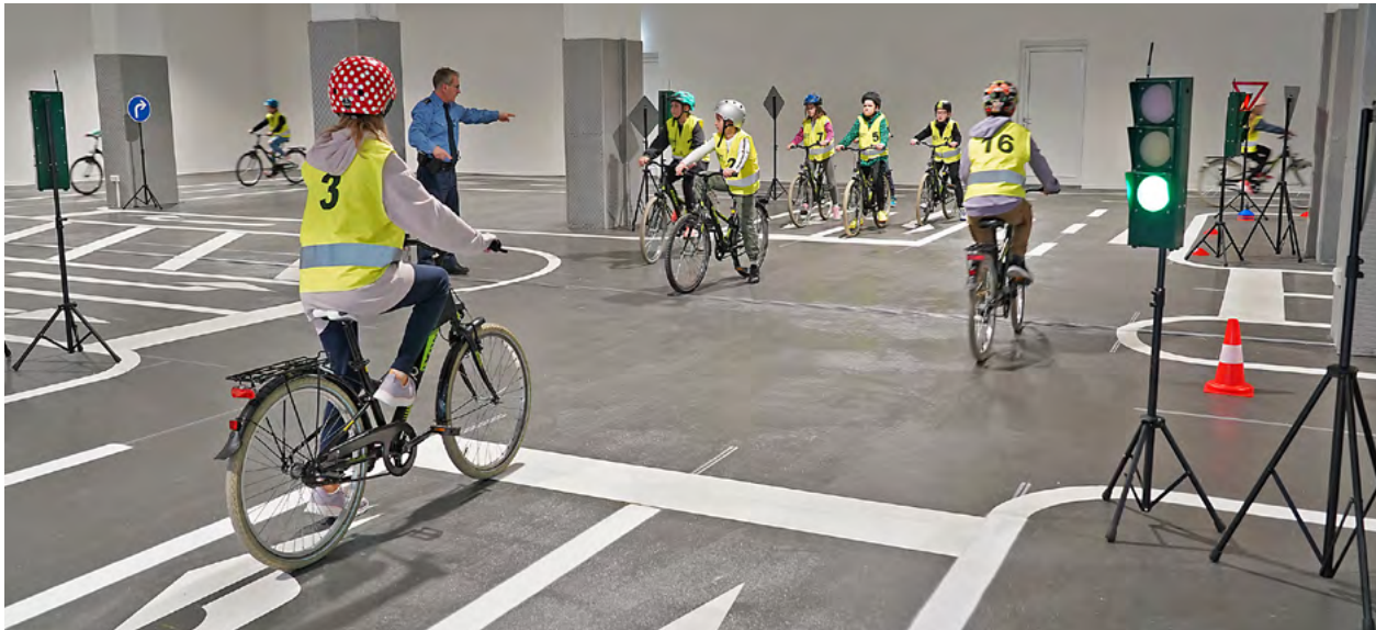
Auf dem neuen Verkehrsübungsplatz in einer Halle an der Konradstraße können die Grundschülerinnen und Grundschüler ab sofort witterungsunabhängig im sicheren Fahrradfahren ausgebildet werden.