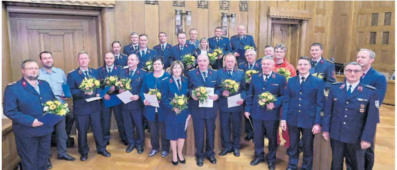
In der vergangenen Woche ehrte Bürgermeister Knut Kunze (rechts) verdienstvolle Chemnitzer Feuerwehrleute. Diese Zeremonie gehört alljährlich zur guten Tradition im Chemnitzer Rathaus.

Es gehört seit vielen Jahren zur Tradition in Chemnitz, dass alljährlich im November die verdienstvolle Tätigkeit von Angehörigen der Freiwilligen Feuerwehren und des Katastrophenschutzes besonders gewürdigt wird.