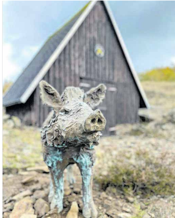
Am Sauberg in Ehrenfriedersdorf säumt nun eine bronzene Wildschweingruppe den Purple Path. Carl Emanuel Wolff, Wildschweine, Courtesy: Carl Emanuel Wolff. Foto: Thomas Liebert

Das Museum in der Zinngrube Ehrenfriedersdorf hat außerdem die