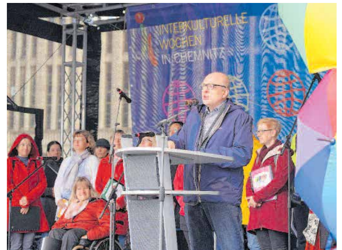
Oberbürgermeister Sven Schulze eröffnete die diesjährigen Interkulturellen Wochen.

Das ausführliche Programm steht unter www.chemnitz.de/ikw .