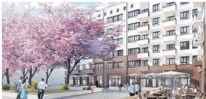
Visualisierung: BPD Immobilienentwicklung GmbH

die Bahnhofstraße, Anbringung von Nistmöglichkeiten und Barrierefreiheit. Nach der Vortragsreihe und einer Fragerunde nutzten die Gäste die Gelegenheit, Pläne zu studieren und Modelle zu betrachten.