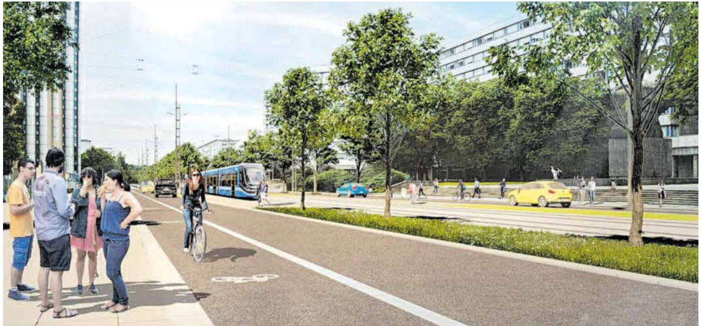
Diese Visualisierung zeigt den künftigen Blick auf der Brückenstraße in Richtung Theaterstraße.

Robert Klitzsch ist Leiter des Projekts Chemnitzer Modell Stufe 4 Chemnitz – Limbach-Oberfrohna (CM4), das den Bahngleisbau in der Innenstadt beinhaltet: „Es gab viele Fragen zu Details der Planung. Autofahrer wollten wissen, ob noch genügend Platz für sie bleibt, und Radfahrer erkundigten sich, wie deren Wege im Projekt berücksich-