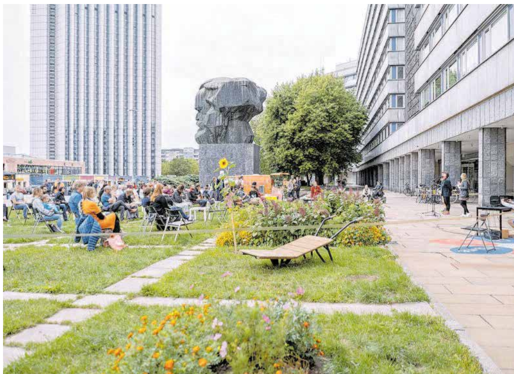
Das »Staut-Festival« bezog im vergangenen Jahr auch das Areal um das Karl-Marx-Monument mit ein.